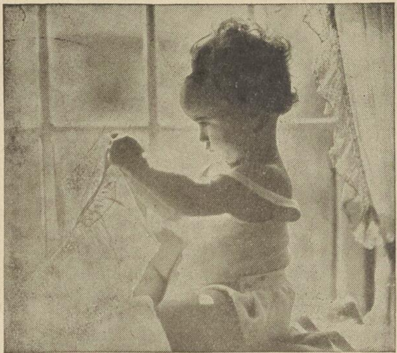
Prise avec une vitesse d'obturation de 1/25 de seconde et un degré d'ouverture de f/45, cette photo est une preuve qu'on peut prendre de très bonnes photos à l'intérieur avec la lumière normale du soleil.