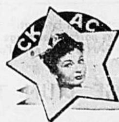
Photo-Concours chez les MARCHANDS à L'ÉTOILE D'OR