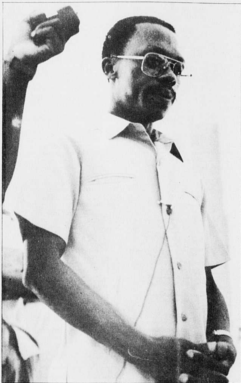
Jean-Bertrand Aristide en campagne en décembre 1990.

5 — Considérant que l'absence d'une ferme intervention immédiate de la part des instances dirigeantes de la communauté internationale consti-