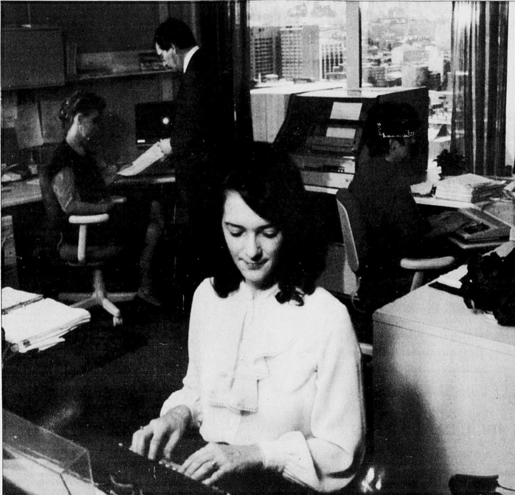
Au Québec, les employeurs et les entreprises ont pleinement collaboré à contrer le harcèlement sexuel en milieu de travail.

« On a fait de véritables progrès, Voir page B-2 : Harcèlement