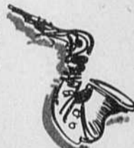
FESTIVAL DE JAZZ DE MONTREAL

En moins de temps qu'il n'en faut pour crier jazz, je me transforme en une sorte d'explorateur hardi qui, onze fois en onze jours, détache les amarres de sa Pontiac Sunbird et quitte sans regarder derrière lui le cottage semi-détaché familial, guidé par l'instinct aiguïlé de l'aventurier, armé d'un sextant, d'une boussole et de son courage, ramant à travers rues et boulevards aux noms exotiques, Olier, Renoir, Lacordaire, Industriel, Louvain, Christophe-Colomb, Mentana, Saint-Joseph, Saint-Urbain, Mont-Royal et de Bleury, bravant mille périls jusqu'aux rives d'une île enchantée, véritable en-