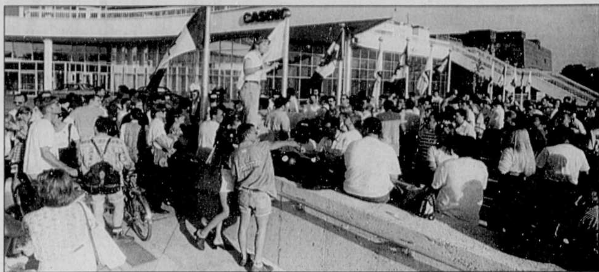
Les employés assignés à la restauration au Casino de Montréal ont cessé leur travail hier soir.

«J'aurais de sérieuses prétentions si je vous disais que le Casino fonctionne bien, a avoué M. Tardif. On évalue la situation heure après heure.» Les croupiers, affiliés à la FTQ, ne sont pas impliqués dans le litige pour le moment.