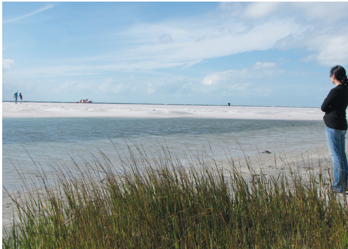
L'environnement sablonneux du parc Fort De Soto.

Au printemps, le camp d'entraînement de base-