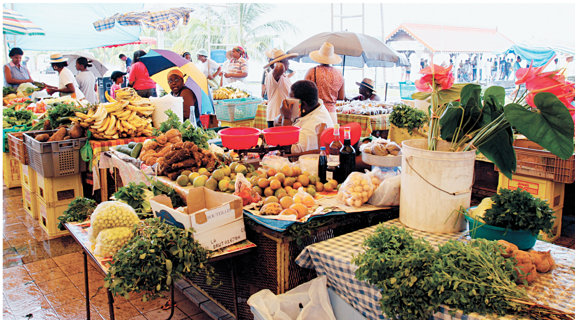
Des produits locaux sont en vente au marché du village de Saint-Pierre, dans le nord-ouest de la Martinique.

Pour des adresses en Corse, vous pouvez consulter des Long-courrier précédents.