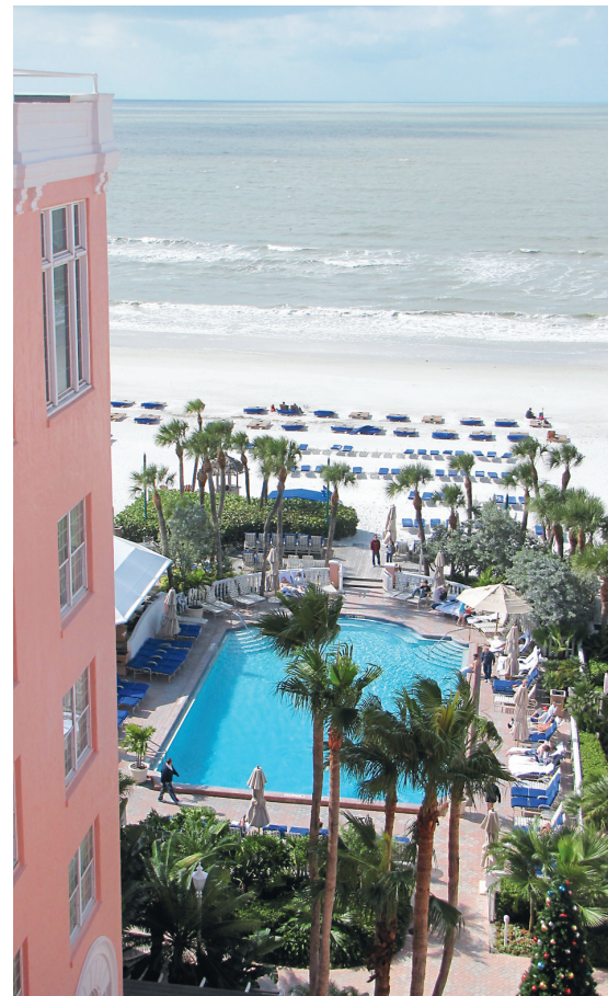
Le golfe du Mexique vu depuis une chambre du Pink Palace.