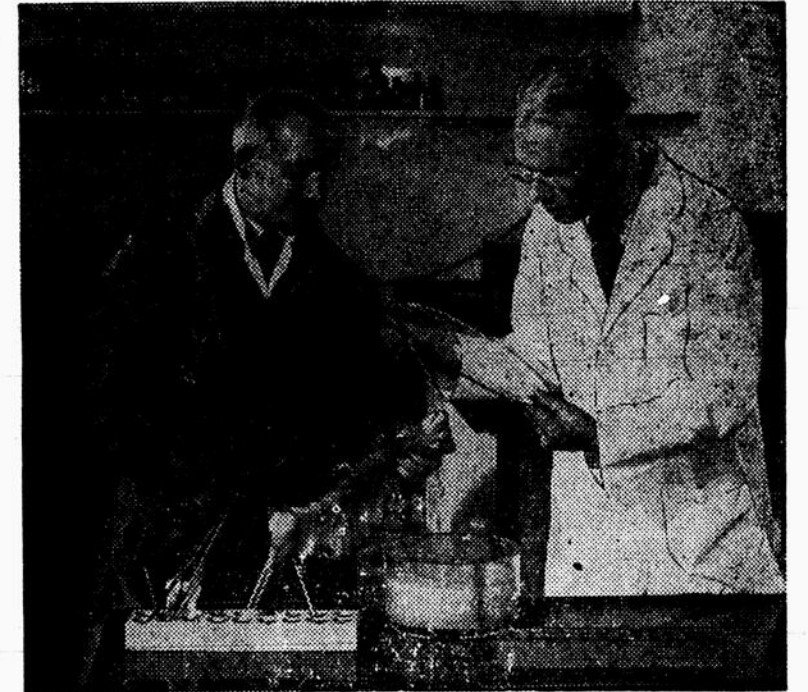
Le centre international de l'influenza, créé à Londres, en 1947, par l'Organisation mondiale de la santé, étudie avec la plus grande attention les développements de l'épidémie de grippe qui sévit actuellement en Europe. Ci-dessus, des techniciens du Centre inoculent un furet avec des spécimens de virus provenant de Yougoslavie. Lorsque les différents types de virus auront été déterminés, les renseignements seront transmis à la Yougoslavie ainsi qu'aux différents organismes de l'Organisation mondiale de la santé.