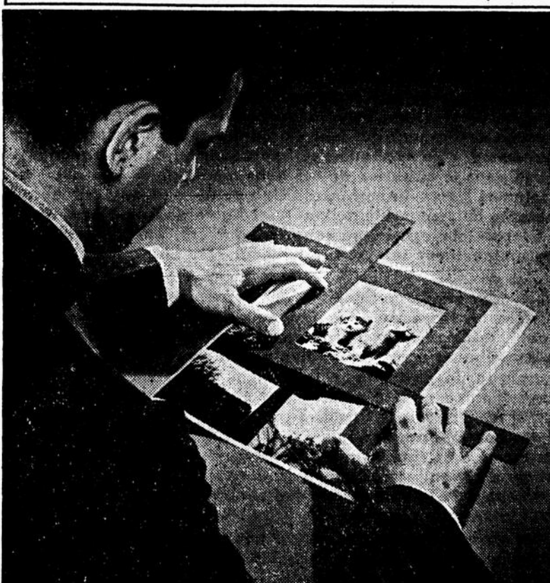
L'émondage, tel que démontré ici, a valu un premier prix à cet instantané.