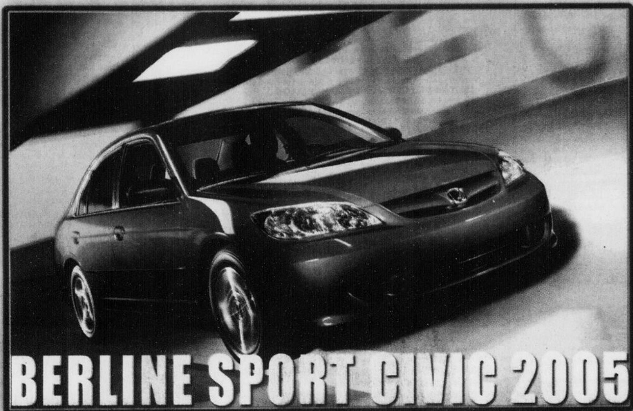
BERLINE SPORT CIVIC 2005

0$ COMPTANT DÉPÔT DE SÉCURITÉ Transport et préparation inclus