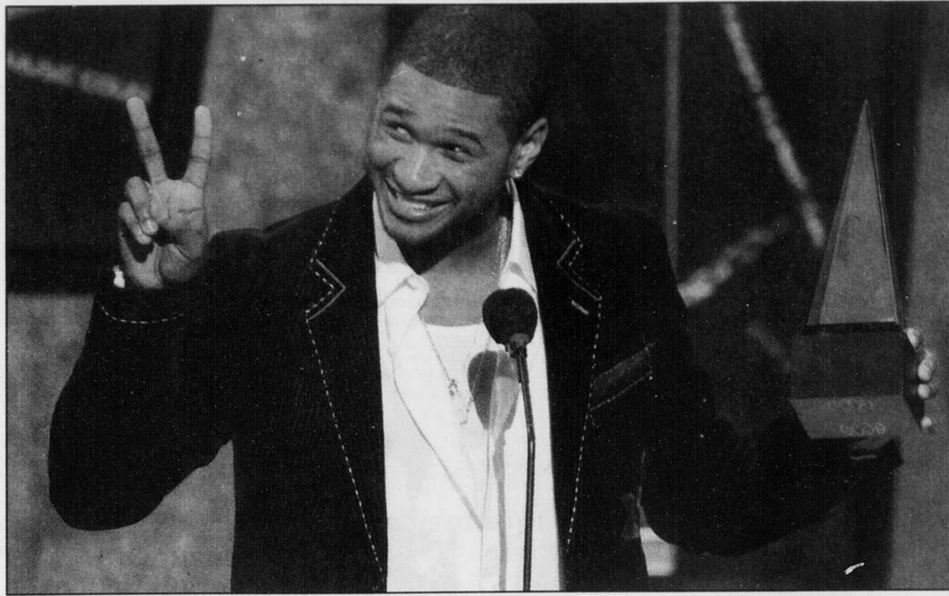
Usher a eu le meilleur sur des artistes comme Josh Groban, Lenny Kravitz, Michael MacDonald, Prince, R. Kelly et le gagnant d'American Idol, Ruben Studdard.

Deux entrées canadiennes dans ce concours de popularité, mais aucun gagnant. Avril Lavigne a été battue par Sheryl Crow pour le titre de meilleure artiste dans la catégorie pop-rock, tandis que le groupe Nickelback, de Vancouver, a baissé pavillon devant Outkast dans la même catégorie.