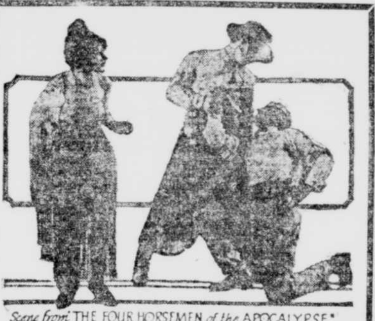
Scene from THE FOUR HORSEMEN of the APOCALYPSE