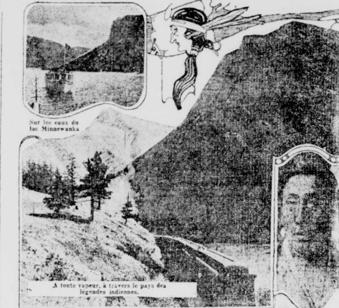
À toute vapeur, à travers le pays des légendes indiennes.

Conservées jusqu'à nous par la tradition, ces légendes curieuses ont survécu en dépit de la marche progressive de la civilisation. Les aborigènes de l'Alberta et de la Colombie-Anglaise nous ont cédé les charmantes récits créés par leur vive