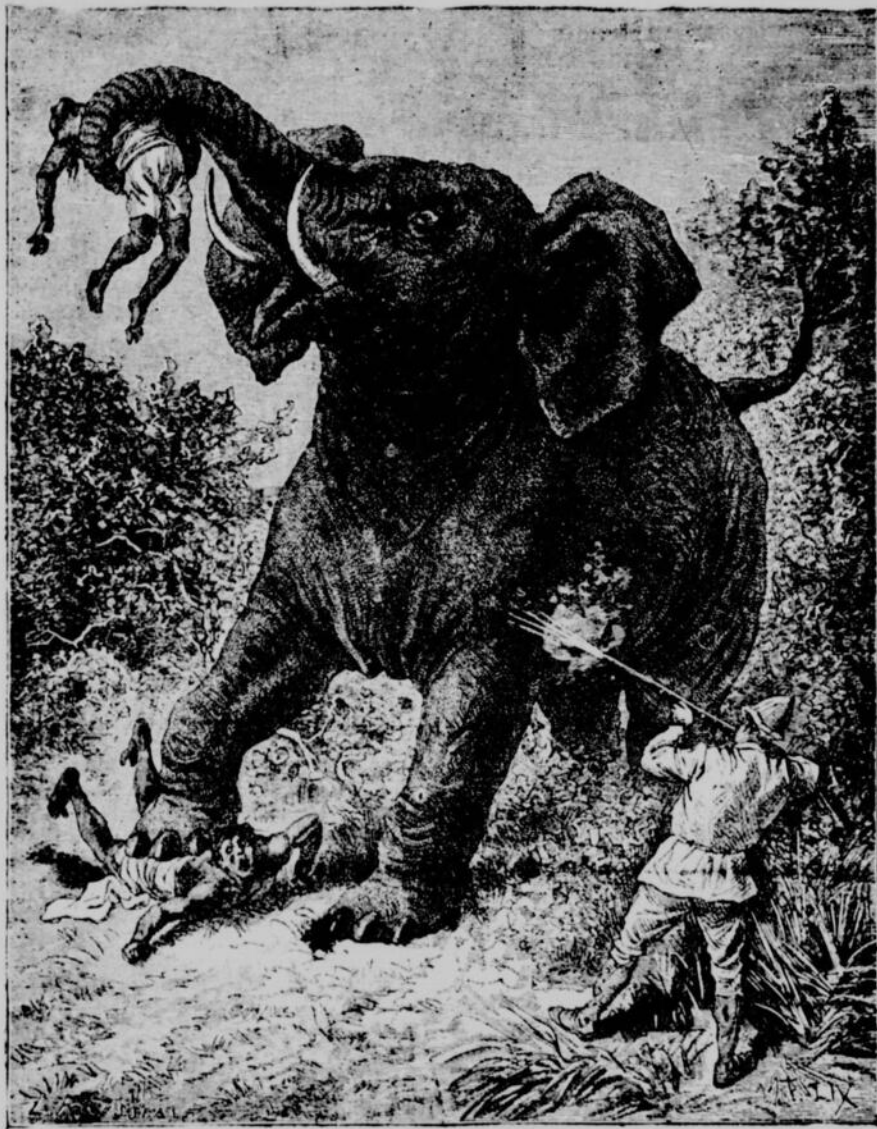
Une chasse à l'éléphant.—Gravure tirée de : Un hiver au Cambodge .

Chez tous les peuples civilisés on se débarrasse des incendiaires et on fait bien. Mais, si je n'ai pas l'intention de m'apitoyer sur leur sort, je dois vous dire qu'au Cambodge on ne met pas le feu