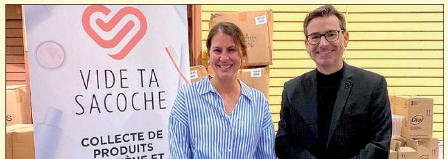
Le 1 er novembre, visite et rencontre avec Vide ta sacoche. Le député est fier de soutenir Vide ta sacoche, une organisation qui effectue la collecte et la distribution de produits d'hygiène et cosmétiques neufs et non ouverts, non utilisés et non périmés pour les personnes en situation de vulnérabilité dans la région de Québec.