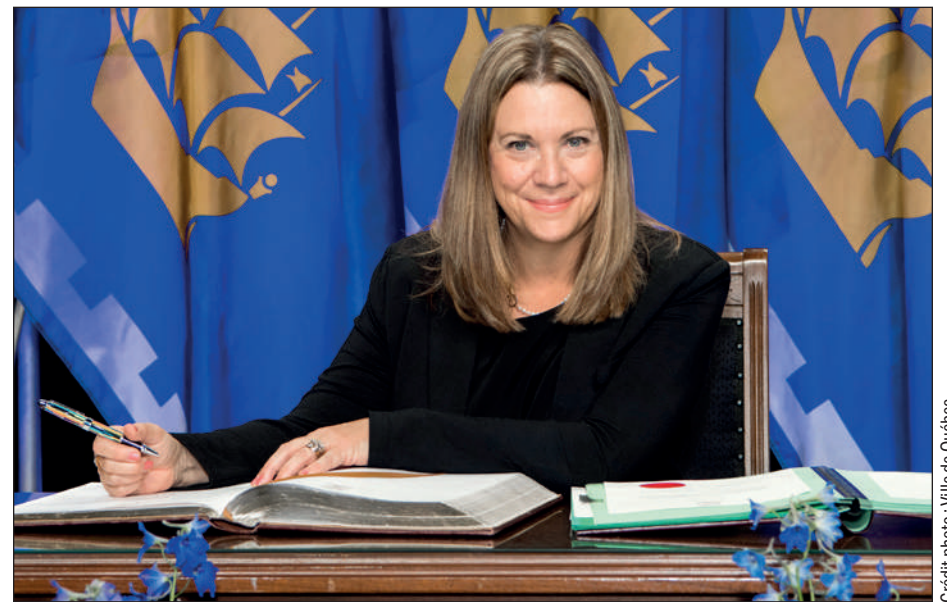
Photo prise à l'assermentation en novembre 2021.