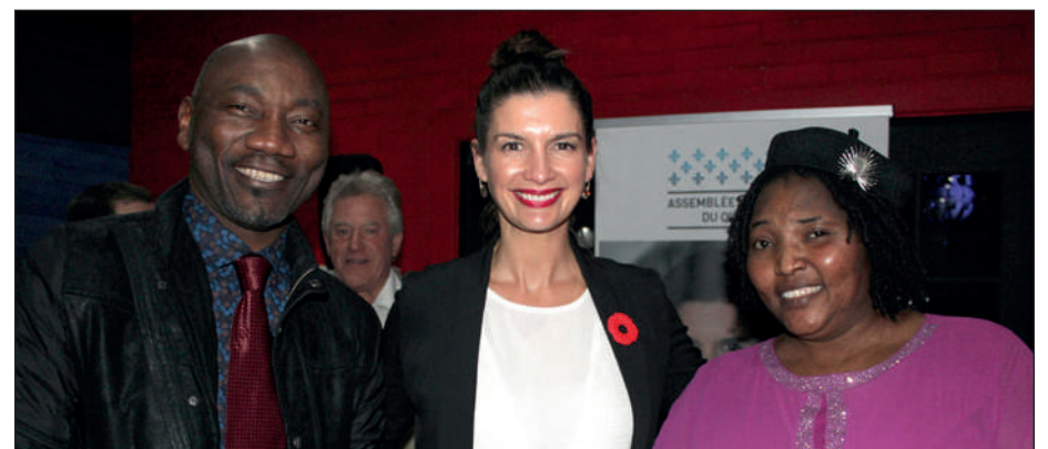
Les commerçants et entrepreneurs de l'artère étaient heureux d'échanger avec leur députée à l'occasion de l'activité de réseautage qui se déroulait à l'Envers Resto-ambiance du Campanile.