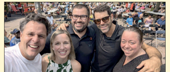
L'Association des gens d'affaires du Campanile convie citoyens, commerçants et organismes de la communauté de la Pointe-de-Sainte-Foy à l'occasion du Forum « Rêvons notre Campanile » le 10 décembre prochain.

L'Association des gens d'affaires du Campanile convie citoyens, commerçants et organismes de la communauté de la Pointe-de-Sainte-Foy à l'occasion du Forum « Rêvons notre Campanile » le 10 décembre prochain. ■