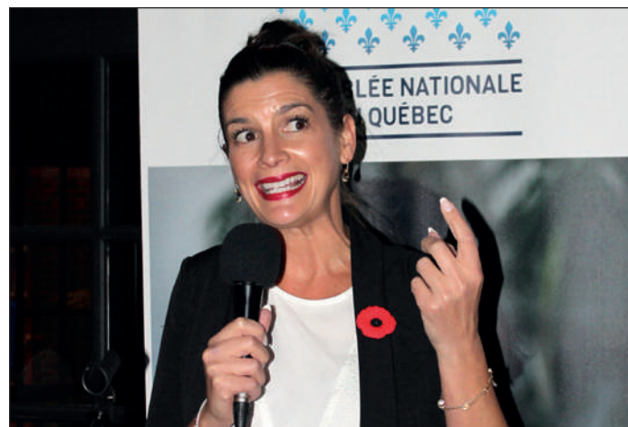
« Je suis très heureuse de participer au 5 à 7 avec l'Association des gens d'affaires du Campanile, dont la mobilisation a littéralement ressuscité notre rue », a déclaré la députée.