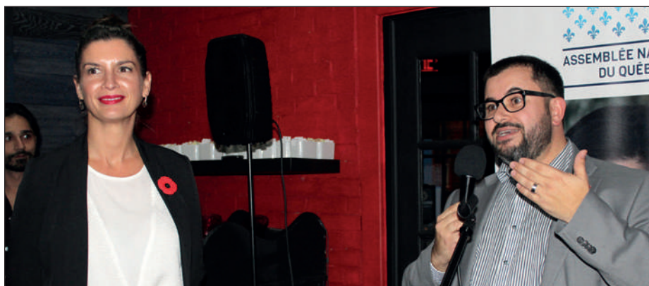
La ministre Geneviève Guilbault a tenu à saluer la mobilisation de l'Association des gens d'affaires qui a littéralement transformé la rue du Campanile.