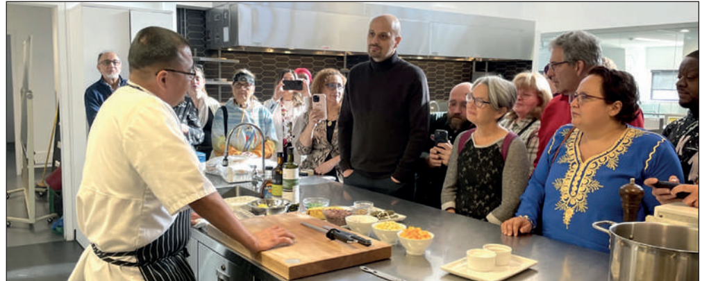
Dans le cadre de ce programme, le chef Craig a aussi offert une présentation et un masterclass aux étudiants et chercheurs de l'INAF

La seconde journée de la visite a été consacrée à la collaboration avec KWE! À la rencontre des peuples autochtones et le restaurant La Traite, incluant un 5 à 7 favorisant les échanges interculturels et la célébration de notre culture et notre histoire autochtones communes. De plus, un menu spécial célébrant cette collaboration sera disponible au cours du mois de novembre à La Traite. ■