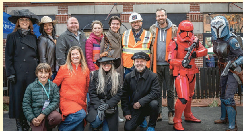
Élus et partenaires de l'événement étaient ravis du succès du Campanile Fête Halloween.