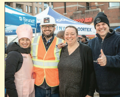
Les membres du conseil d'administration de l'Association des gens d'affaires du Campanile étaient heureux du succès de la 2 e édition du Campanile Fête Halloween.