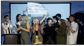
L'équipe de Ensemble lors du gala de 2023.