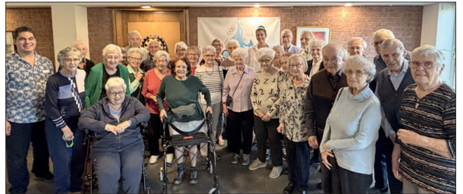
Journée chargée dans Louis-Hébert! La députée, vice-première ministre et ministre des Transports et de la Mobilité durable a fait des visites aux résidences Chartwell L'Envol et Les Jardins Logidor au grand bonheur des résidents qui ont pu échanger avec elle sur l'actualité ainsi que sur la politique provinciale avec leur élue.