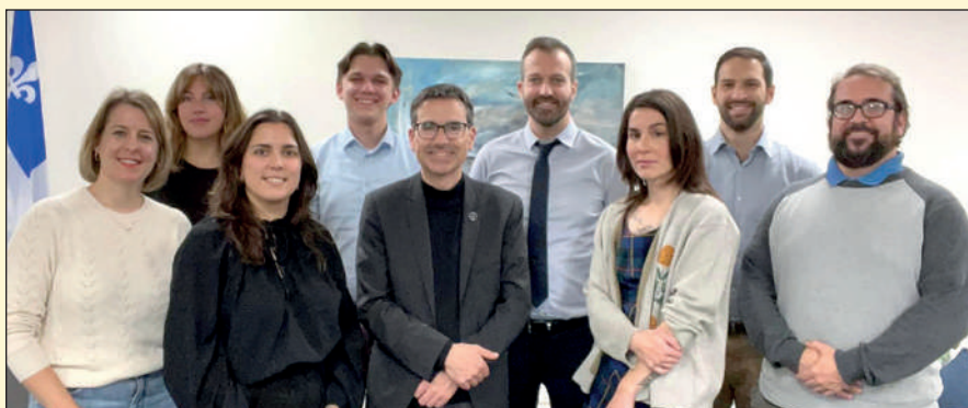
Le 16 octobre, le député et son équipe rencontre l'équipe de Joël Lightbound, député fédéral. Les deux équipes collaborent étroitement pour les services d'aide aux citoyens.