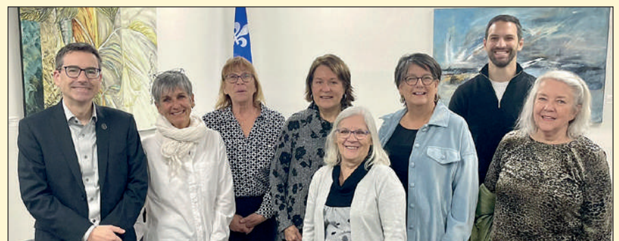
Puis, le 15 octobre, installation des cadres de la Société artistique et culturelle de Québec au bureau de Jean-Talon. L'exposition de cinq artistes tiendra jusqu'au 13 janvier 2025.