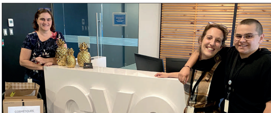
Quelques employés de Groupe Voyages Québec, qui ont remis à l'organisme une 2 e généreuse récolte de dons de produits cette année.

Pour faire un don monétaire ou un don de produits neufs et de qualité dans l'un des points de dépôt de l'organisme : videtasacoches.com. ■