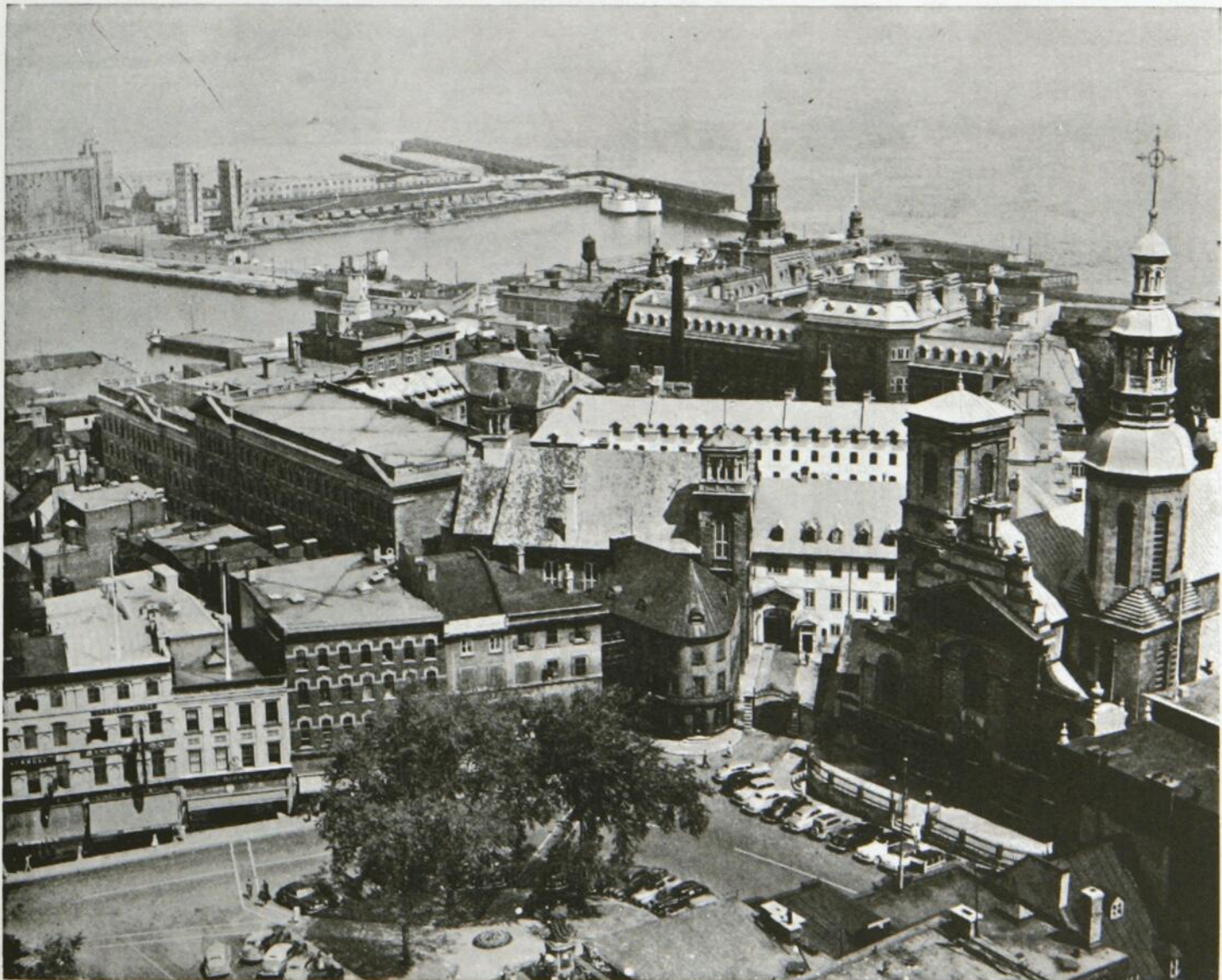
UNE PARTIE DU VIEUX QUEBEC

Quebec City, the population of which exceeds 165,000, will attain in the relatively near future, according to the present rate of increase, 200,000.