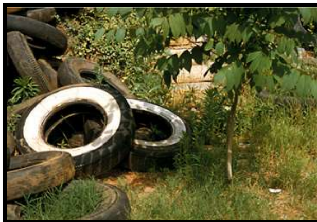
Figure 8. Les pneus usagés entreposés à ciel ouvert constituent un gîte larvaire idéal pour certaines espèces de moustiques.