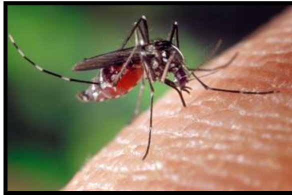
Figure 7. Aedes albopictus