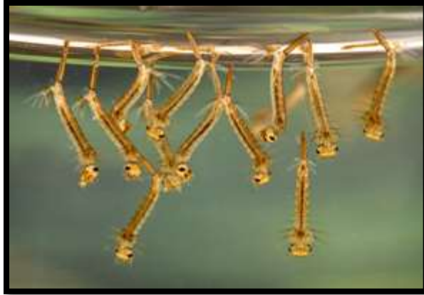
Figure 5. Larves du genre Culex sp.