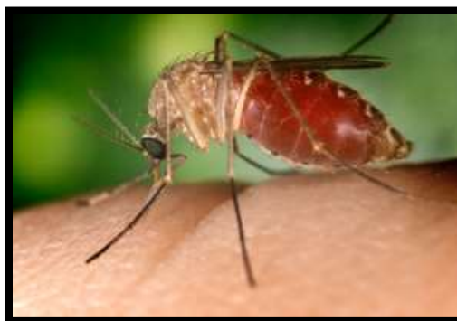
Figure 2. Culex quinquefasciatus