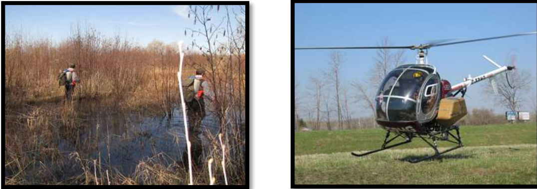
Figure 6. Diverses méthodes d'application de larvicides

Le méthoprène, aussi appelé « (S)-méthoprène », est un régulateur de croissance analogue à l'hormone juvénile qui est naturellement présente chez les moustiques. Au Canada, il a été homologué pour un premier usage en 1977.