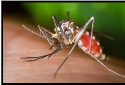
Figure 1. Ochlerotatus triseriatus

Le Québec constitue un vaste territoire couvert principalement de forêts, de lacs et de rivières. Ces aires naturelles sont favorables à la prolifération de nombreuses espèces d'insectes piqueurs, notamment les simulies (mouches noires) et les moustiques (maringouins). Alors que les larves de simulies se développent surtout dans les eaux des déversoirs de lacs et de rapides à fond rocheux, les larves de moustiques pullulent dans les milieux où il y a présence de tourbières, de marais et de marécages ainsi que dans les eaux stagnantes (tonneaux, arrosoirs, bassins, vieux pneus, etc.). On ne trouve aucun gîte de développement des larves de moustiques dans les ruisseaux et les rivières.