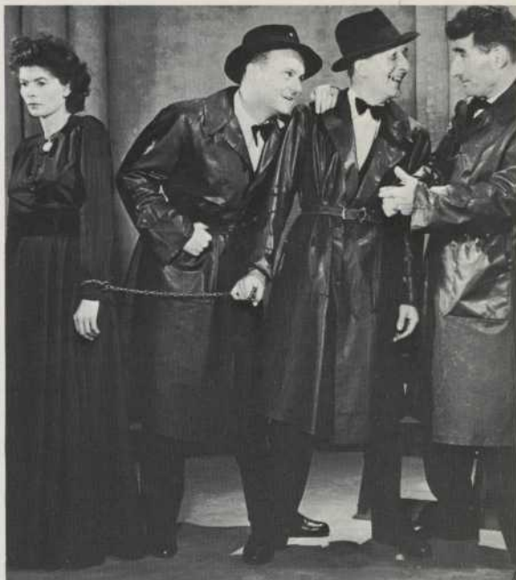
LORS DE LA CRÉATION DE LA PIÈCE EN 1944

MOLIERE-ANOUILH: Cahiers de la Compagnie Madeleine Renaud, Jean-Louis Barrault (Extrait d'un article d'André BARSACQ, Edition Julliard)