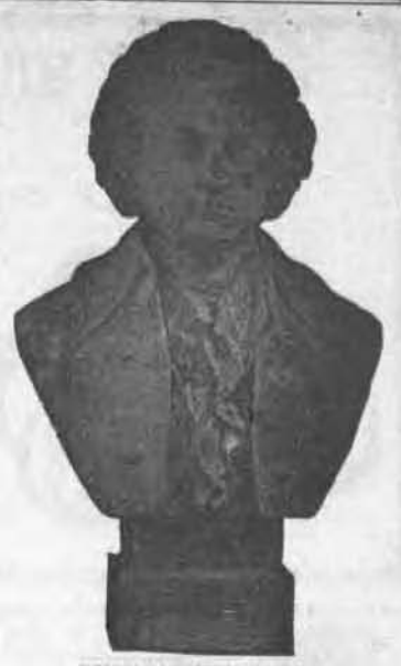
BUSTE DE MOZART

Envoyé gratuitement à toute personne qui nous fera tenir le prix de deux abonnements d'un an, soit $3.00. Sans préjudice à la prime régulière. En dehors de Montréal, ajouter 30c pour la poste.