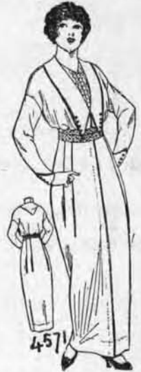
4571. — Robe de jeune fille, 3 grandeurs, 14-16-18 ans. Matériaux: 2 vgs. 1/2 en 30 pcs. pour 16 ans.

Les lectrices du "Passe-Temps" peuvent obtenir des patrons aux conditions ordinaires. Voici le coupon qui doit être rempli (ou recopié) avant d'être retourné au "Département des Patrons" du "Passe-Temps", Montréal.