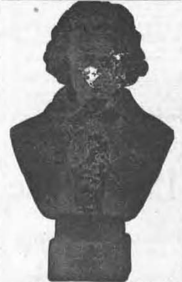
BUSTE DE BEETHOVEN

Envoyé gratuitement à toute personne qui nous fera tenir le prix de deux abonnements d'un an, soit $3.00. Sans préjudice à la prime régulière. En dehors de Montréal, ajouter 30c pour la poste.