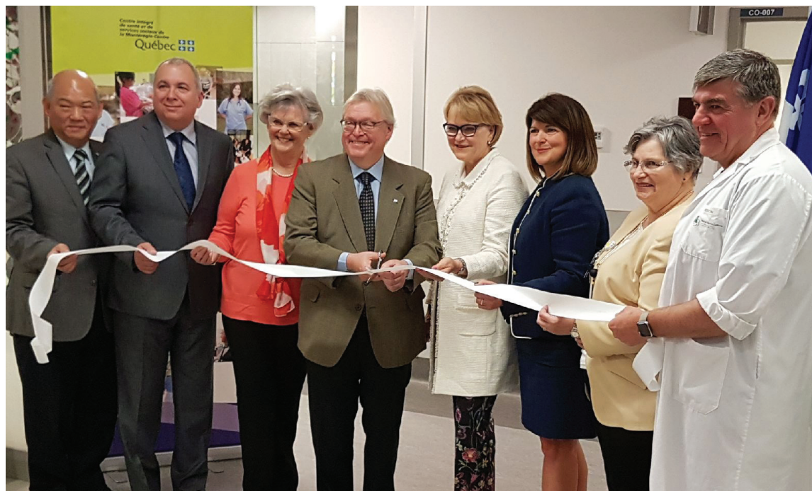
La nouvelle urgence de l'Hôpital Charles-Le Moyne a été inaugurée le 5 juin 2017, en présence du ministre Gaétan Barrette.

La Fondation est fière d'avoir contribué à la réalisation de ce projet d'envergure financé, en partie, grâce à votre générosité. Représentant souvent le premier contact des patients avec l'Hôpital, ce sont vos dons qui ont permis à la Fondation de verser 1 million $ pour la construction d'une urgence à la hauteur du plus important Hôpital en Montérégie.