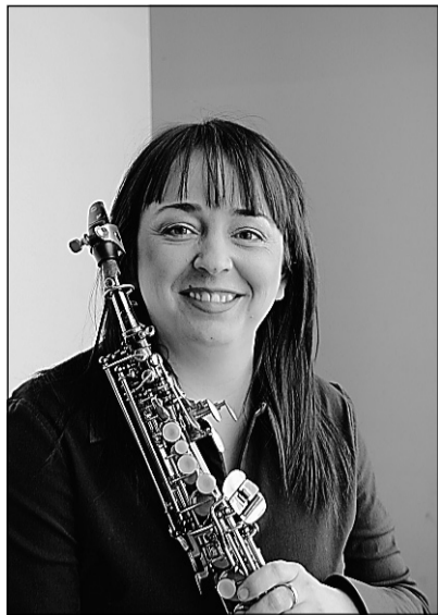
Marie-Chantal Leclair a créé plus d'une quarantaine d'œuvres.

En dernier lieu, le quatuor Quasar se retrouvera le 8 mars à la Salle Pollack aux côtés de l'Orchestre symphonique de Montréal pour y interpréter deux œuvres : Alighieri de Vincent-Olivier Gagnon ainsi que Fearful