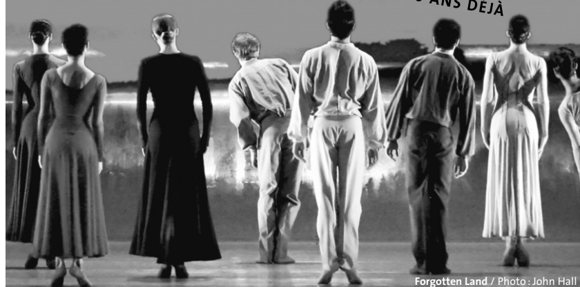
Forgotten Land / Photo: John Hall