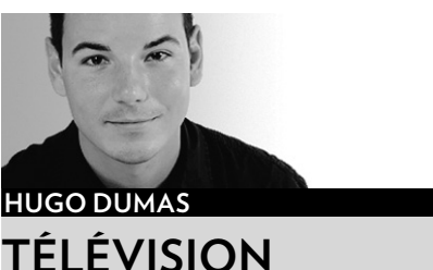
HUGO DUMAS TÉLÉVISION

Nos humoristes n'auront pas à se cloner pour assister simultanément, le soir du 6 mai, au gala 25 e anniversaire de Juste pour rire à TVA et à la cérémonie des Olivier, présentée pour la première fois sur les ondes de Radio-Canada.