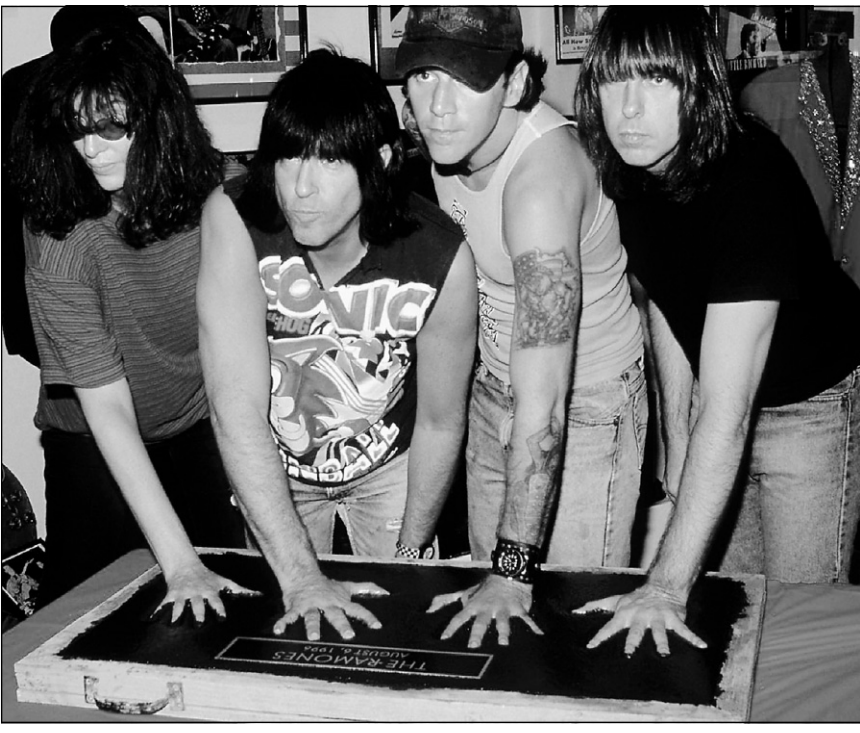
Les Ramones honorés en 1996.