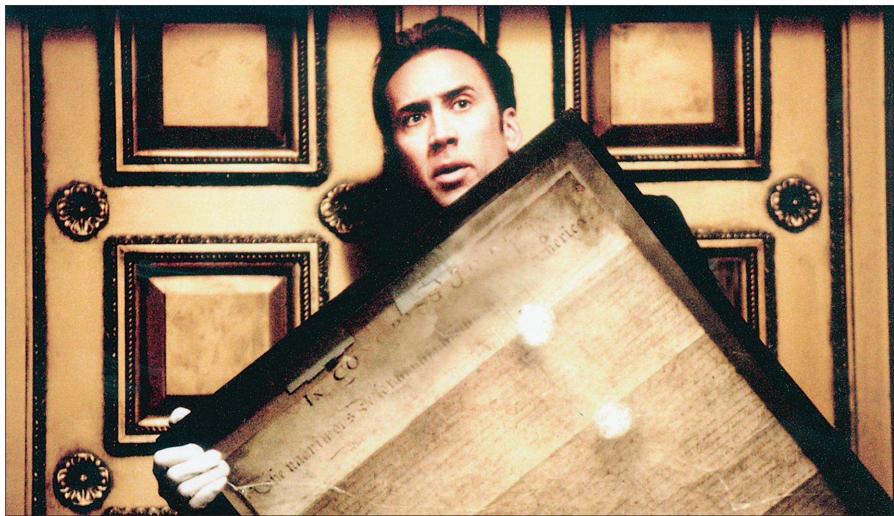
Pour retrouver un trésor mythique, Benjamin Franklin Gates ( Nicolas Cage) doit débusquer un indice crucial dissimulé... à l'endos de la Déclaration d'indépendance des États-Unis.

Fantasma James Bond mis à part, il reste que National Treasure , dont la distribution est solide (outre Cage, le film a pour têtes d'affiche Jon Voight, Sean Bean, Diane Kruger, Justin Bartha, Harvey Keitel et Christopher Plummer), a permis à la production de parcourir l'Amérique puisque plusieurs scènes ont été tournées au coeur même des lieux historiques où le récit mène les personnages. Du Lincoln Memorial de Washington jusqu'à l'Indépendance Hall à Philadelphie, sans oublier la Trinity Church de New York, plusieurs édifices sym-