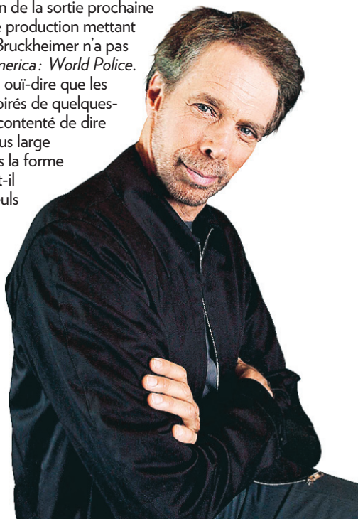
Jerry Bruckheimer

Rencontrant la presse à l'occasion de la sortie prochaine de National Treasure , sa nouvelle production mettant en vedette Nicolas Cage, Jerry Bruckheimer n'a pas voulu se prononcer sur Team America: World Police . «Je ne l'ai pas encore vu mais j'ai ouï-dire que les concepteurs du film s'étaient inspirés de quelques-unes de mes productions», s'est contenté de dire le producteur en affichant son plus large sourire. «La parodie n'est-elle pas la forme la plus sincère de la flatterie?» a-t-il ajouté. Ce sont d'ailleurs là les seuls commentaires qu'a livrés Bruckheimer à propos du film iconoclaste du tandem Trey Parker et Matt Stone, une satire virulente dans laquelle, rappelons-le, des marionnettes chassent le terroriste partout sur la planète. «Peut-être le verrai-je un jour en DVD», a laconiquement dit Bruckheimer, laissant ainsi entendre qu'un prochain visionnement ne figurait vraiment pas sur sa liste de priorités.