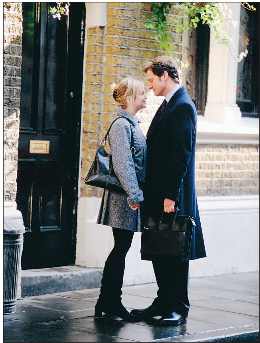
Bridget Jones (Renée Zellweger) file le parfait bonheur avec Mark Darcy (Colin Firth) depuis six semaines. Mais déjà, le doute se montre le bout de son nez.

Domage qu'à l'arrivée, le spectateur n'en sache pas vraiment plus sur les personnages qu'au départ.