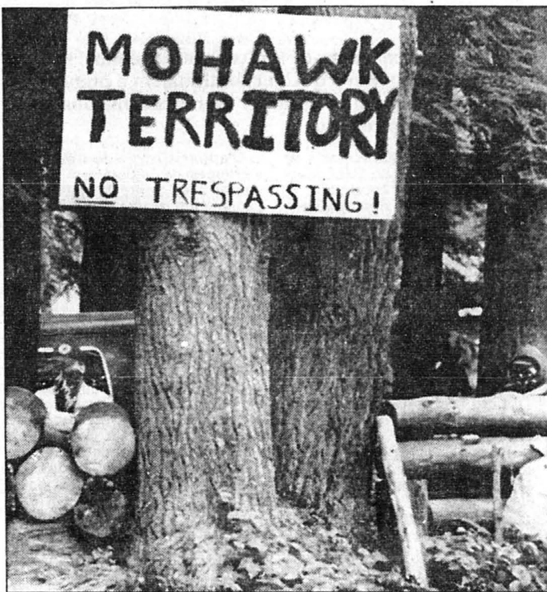
A-t-on oublié que la folie des warriors a détruit, en 1990, lors de la crise d'Oka, d'une manière tout à fait inconsciente, les relations entre les Québécois et les Autochtones du Québec.

tionnistes, au lendemain de l'indépendance du Québec, ou d'un Canada entièrement renouvelé, va rétrécir comme une peau d'animal qui sèche au soleil. Quand ils auront utilisé les Cris et les Inuit jusqu'à la corde pour leurs fins personnelles, ils les rejeteront purement et simplement en les abandonnant aux indépendantistes québécois, ou à un gouvernement fédéral moins menacé politiquement. (...)