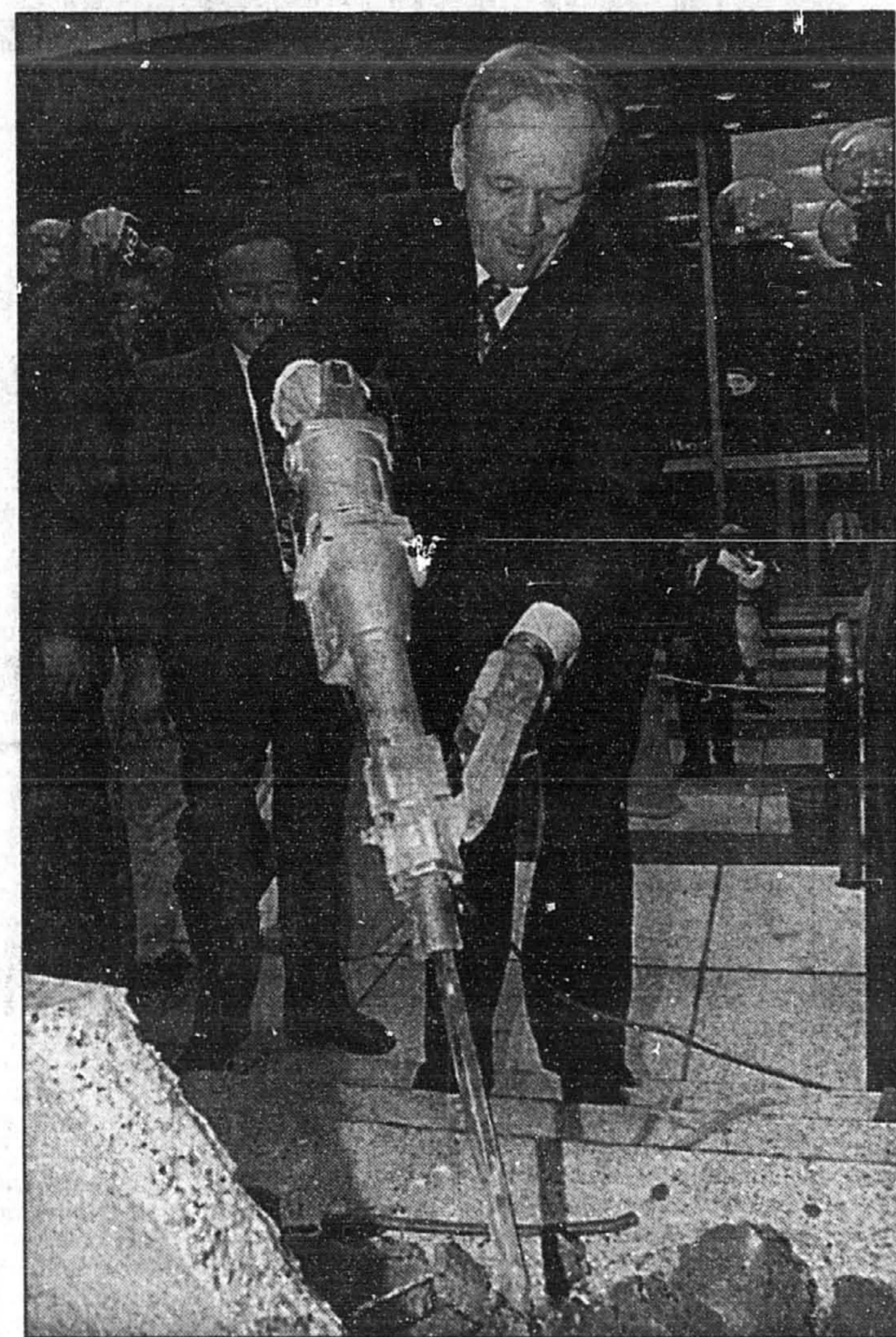
Jean Chrétien a joué du marteau-piqueur après une rencontre avec des dirigeants d'entreprises sur l'emploi des jeunes.