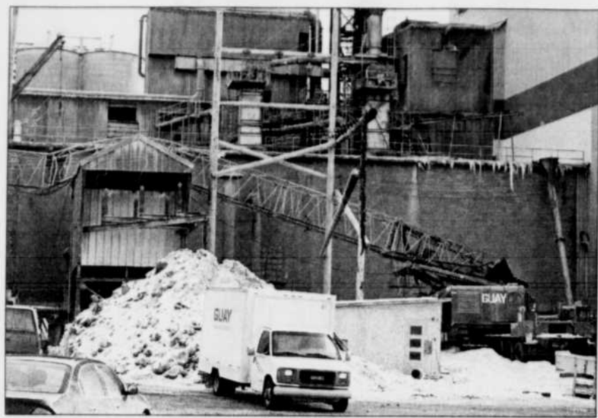
À Saint-Basile de Portneuf, une immense grue de 250 pieds de la compagnie Armand Guay s'est écroulée sur la partie ouest de l'usine Ciment Québec causant des dommages matériels. Heureusement, personne n'a été blessé. Un transformateur électrique a été touché pendant la chute perturbant les opérations de l'usine. La grue était inopérante, tôt hier matin, quand le vent l'a fait basculer. Le mat métallique s'est étendu de tout son long, se brisant et se tordant au contact de la bâtisse. Pendant toute la journée, des ouvriers se sont affairés à sortir la grue de sa fâcheuse position