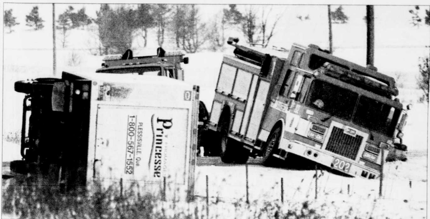
C'était difficile pour tout le monde hier, même pour ceux qui allaient porter secours aux victimes du verglas ou des rafales de vents. Ainsi, sur la rue Blaise-Pascal, il y a eu un camion qui s'est renversé, puis une automobile qui a quitté la route à son tour pour se faire heurter par le camion de pompier qui a quitté la route, imité enfin par une autopatrouille. Quand ça va mal...