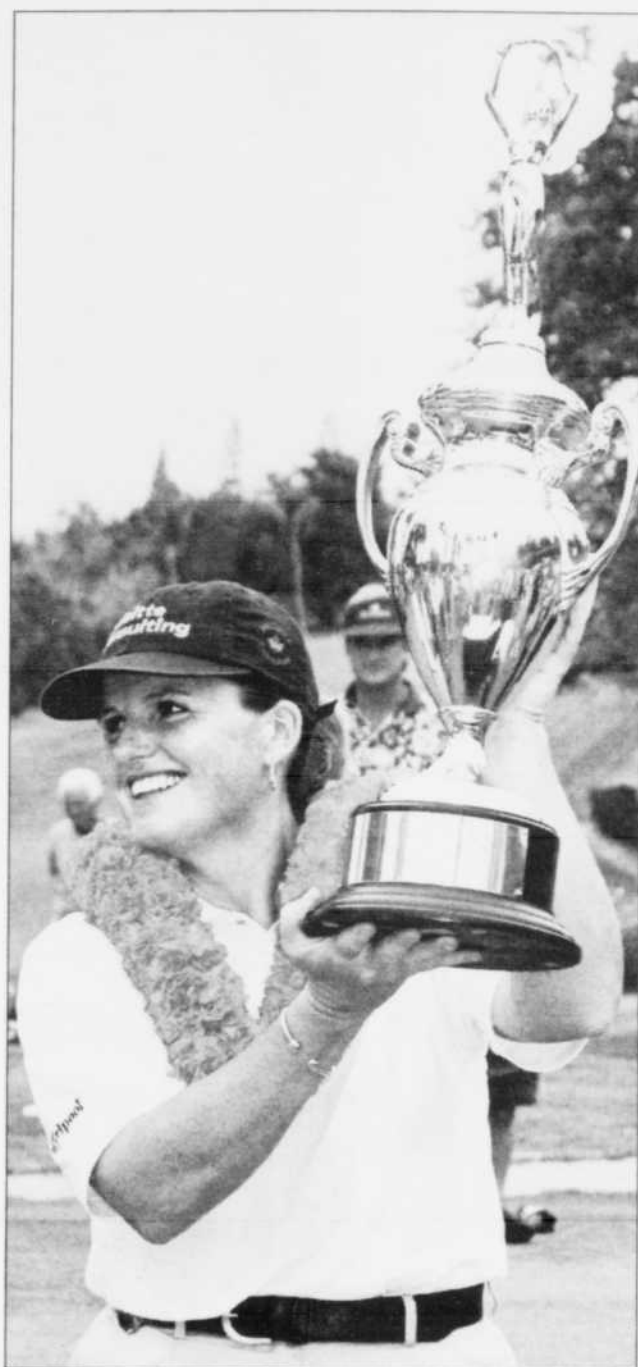
Pas de doute, Lorie Kane était vraiment la reine de l'île, hier à Keauhou.

« Nous devons tous y aller d'une solide performance de-