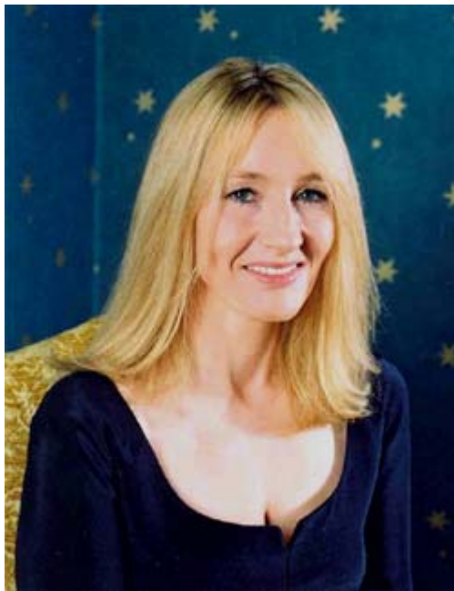
J.K Rowling -

Les fans du fameux Harry Potter ne peuvent plus se contenir tellement ils sont fébriles en attendant la date du 16 juillet prochain. L'auteur J.K. Rowling dévoilera alors son nouvel ouvrage, en langue anglaise, Harry Potter and the Half-Blood Prince , le sixième et supposément avant-dernier de la série. Plusieurs librairies canadiennes ont organisé des soirées de veille pour que sur le coup de minuit, les fans puissent se procurer le livre et fêter le lancement. Deux sites Internet sont très intéressants à visiter, celui officiel de l'auteur et un autre, non officiel, mais très respecté par Rowling elle-même, qui a d'ailleurs invité son créateur à Londres pour une entrevue d'une heure le samedi 16 juillet. L'histoire de Rowling est un bel exemple de persévérance malgré les rejets et les difficultés qu'elle a connus au début de sa carrière. www.jkrowling.com www.mugglenet.com