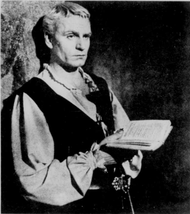
Sir Laurence en Hamlet