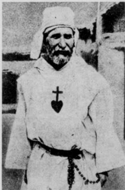
Le Père Charles de Foucauld