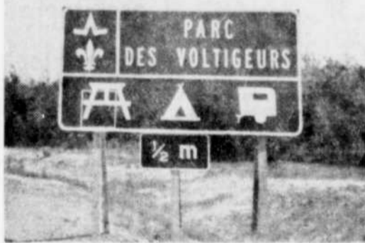
PANNEAU-RECLAME. — Une série de plusieurs grands panneaux-reclame ont été posés récemment sur la route transcanadienne, à proximité du parc des Voltigeurs...