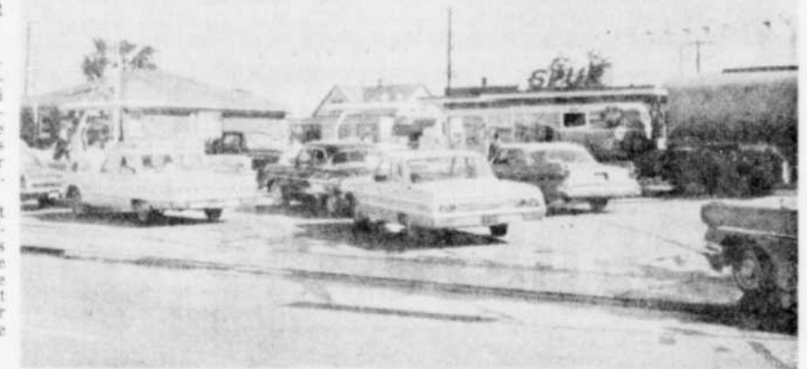
DE LA CLIENTELE. — Les quelques postes d'essence qui étaient demeurés ouverts hier avant midi ont fait des affaires d'or puisque les automobilistes se sont rendus en grand nombre pour se ravitailler.

Toutefois, les commissaires ont jugé inopportun de continuer cette pratique.