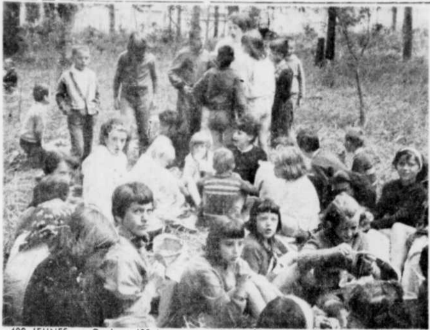
400 JEUNES. — Quelque 400 jeunes ont pris part hier au grand pique-nique d'ouverture de la saison d'activités de l'OTJ de Victoriaville. Le pique-nique avait été précédé d'une messe chantée en plein air par l'aumônier de l'Oeuvre des terrains de jeux, l'abbé Rheault. Sur cette photo on aperçoit un petit groupe de jeunes qui sont à diner, tandis qu'une monitrice dirige un chant à l'arrière.