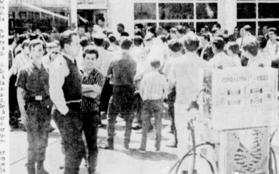
UNE FOULE de curieux ont été attirés à plusieurs reprises hier à divers postes d'essence qui avaient osé ouvrir leurs portes à la clientèle, puisque les grévistes des autres postes s'y rendaient en délégation pour faire cesser toutes les opérations. Hier soir, tous les postes étaient fermés.