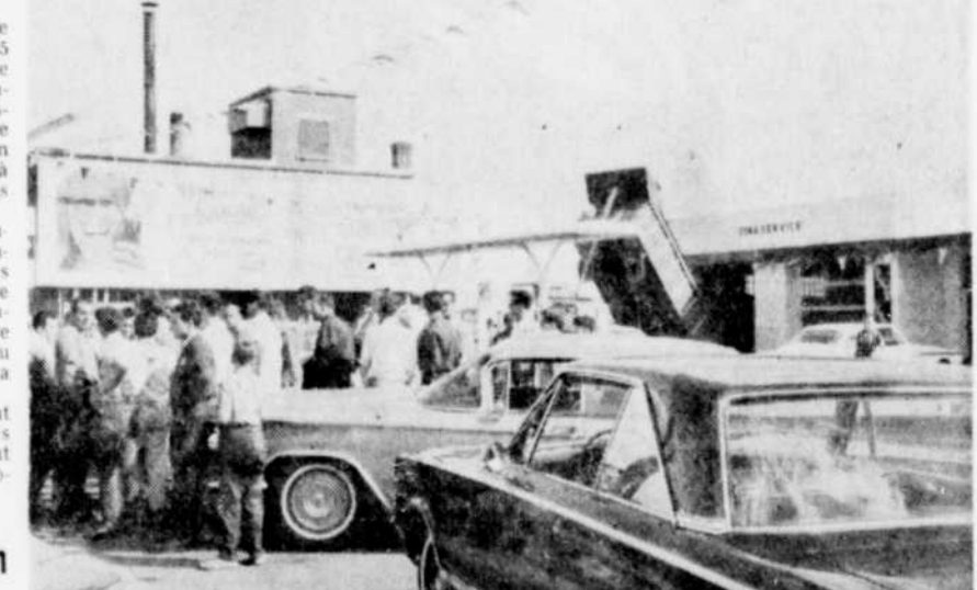
LES GREVISTES de l'essence se sont réunis durant la journée d'hier dans la cour de la station Fina, située dans le bas de la rue Principale. C'est de là qu'une quinzaine de voitures partaient à tout moment pour aller ouvrir un détaillant de ne pas vendre d'essence.