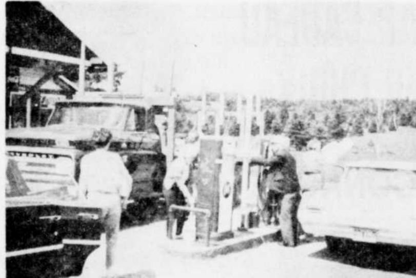
CA PRESSE. — Avant que les stations à essence d'East Angus ne verrouillent leurs portes, il y eut foule à ces stations de service. On remarque ici quelques personnes s'approvisionnant au moyen du premier récipient trouvé, qu'il s'agisse de pots ou de bouteilles d'eau javelante.

Pour former un comité permanent de la Fédération libérale du comté