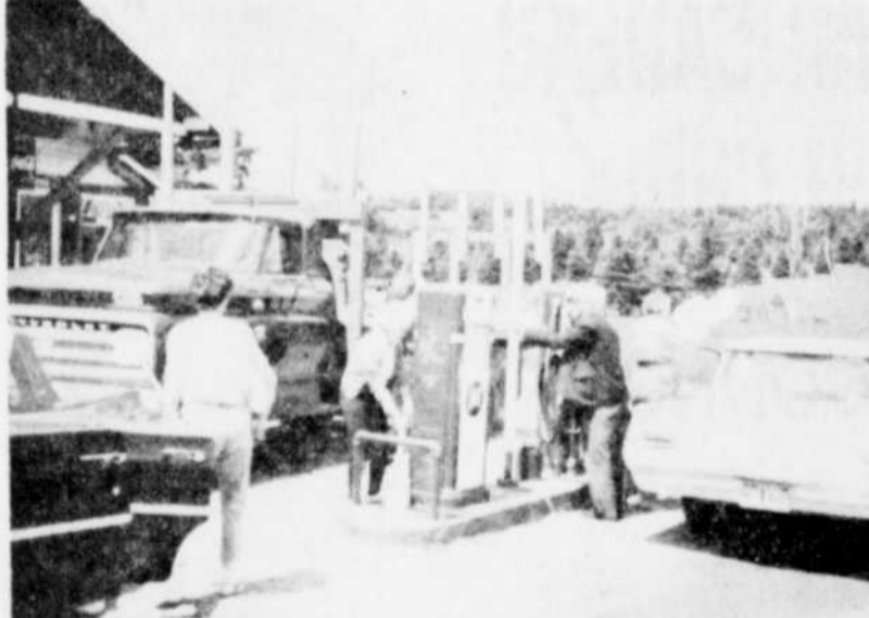
CA PRESSE — Avant que les stations à essence d'East Angus ne verrouillent leurs portes, il y eut foule à ces stations de service. On remarque ici quelques personnes s'approvisionnant au moyen du premier récipient trouvé, qu'il s'agisse de pots ou de bouteilles d'eau javelante.