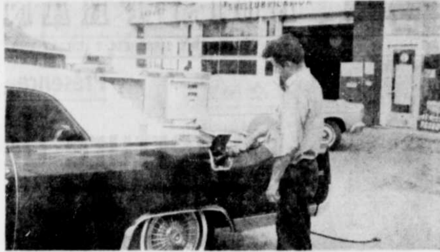
AUJOURD'HUI PEUT-ETRE. — Les détaillants d'essence de Victoriaville n'ont pas refusé hier de fournir de l'essence à leurs clients, tel que le témoigne la photo ci-haut, prise à l'heure du midi à une station-service du centre de la ville. Il n'était pas impossible toutefois à ce moment que les détaillants de Victoriaville à l'instar de leurs confrères de plusieurs villes de la province ferment leurs portes aujourd'hui.