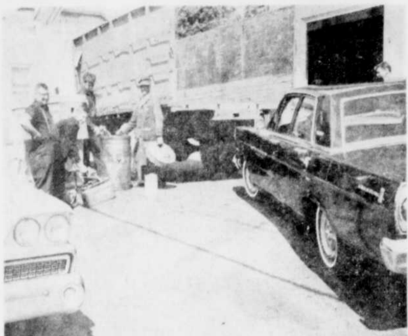
DES CAMIONS, DES BIDONS. — Que d'affluence à une station de service, boulevard St-Luc à Asbestos hier. Et cette scène se répétait partout où l'on pouvait encore offrir une goutte d'essence...