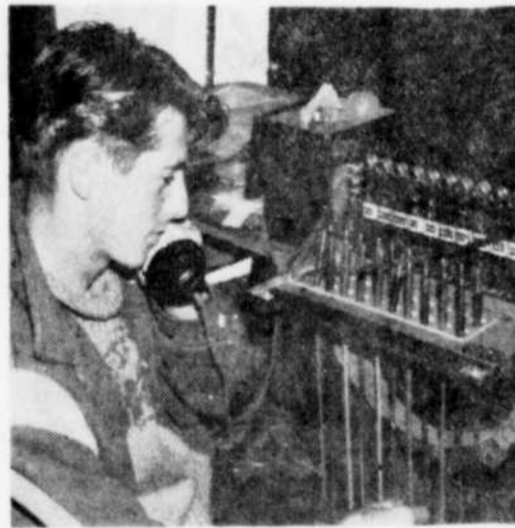
TELEPHONE PORTATIF. — Un standard téléphonique portatif, installé au quartier général du camp scout, assure de rapides communications entre tous les sous-camps...