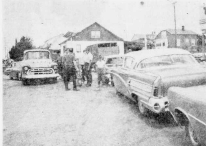
A L'ANNONCE DE LA GREVE des détaillants d'essence, tous les détaillants ne se sont pas immédiatement mis en greve. Ils ont donc ainsi pu bénéficier d'une affluence d'automobilistes. Ce fut le cas à Windsor. Certains détaillants ont servi l'essence sans arrêt depuis 8 heures du matin jusque dans l'après-midi avancé. On a vu des automobilistes emplir leur réservoir et des contenants supplémentaires de plusieurs gallons.