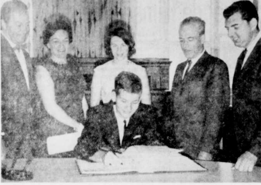
RECEPTION CIVIQUE — Le maire de Granby a reçu hier des étudiants venus de diverses provinces dans le cadre des visites interprovinciales.

GRANBY — Trois garçons ont été blessés à la suite d'accidents de la circulation survenus dans notre région lundi et hier.