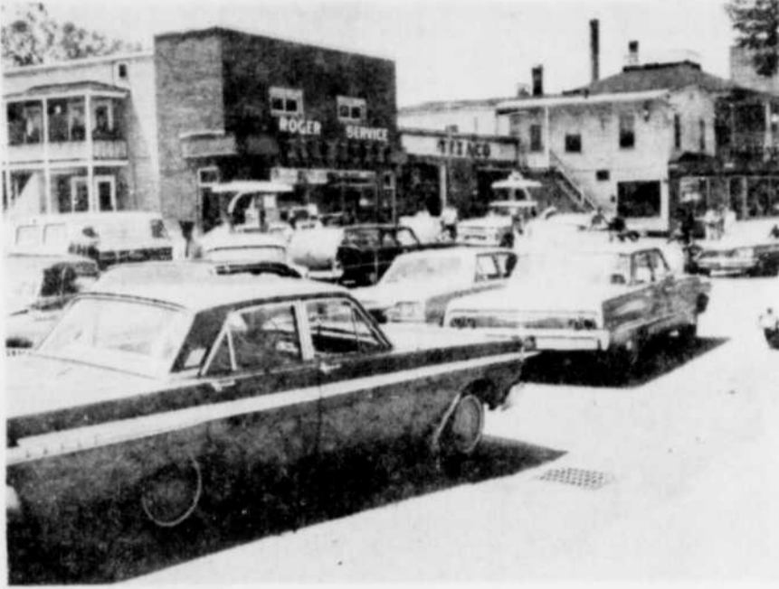
EMBOUTEILLAGE — Les détaillants d'essence de la ville de Magog ont été pris d'assaut tôt hier matin par un grand nombre d'automobilistes qui tenaient à faire le plein avant la fermeture des pompes des stations-services. A certains endroits, les policiers ont dirigé la circulation afin de réduire les embouteillages, dans divers secteurs de la cité.

La partie de dimanche qui pourra voir gratuitement les jeunes, opposera le Canadien et les Indiens de Québec et sera jouée en après-midi.