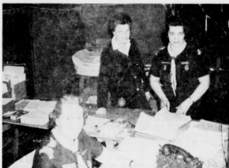
ADMINISTRATION. — Tous les principaux services de l'administration sont assurés par trois demoiselles qui, dit-on, se dévouent depuis le petit jour jusque tard dans la nuit...