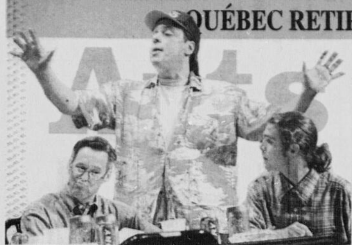
Drôle de couple Une pétillante comédie / Page D2

QUÉBEC RETIRERA 1000 APPAREILS DE LOTERIE-VIDÉO / Page D8