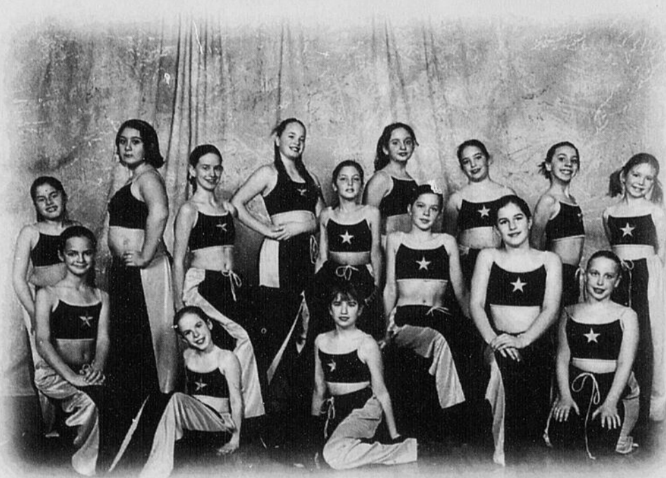
Le Studio de danse Louise Milot donne son spectacle de fin d'année, le dimanche 3 juin, au Théâtre Centennial de Lennoxville, dès 14 h. En tout, 125 élèves, de 3 ans à l'âge adulte, se produiront dans plus d'une vingtaine de chorégraphies. Parmi elles se trouvent les jeunes danseuses qui ont participé au Superstar 2001 et en ont rapporté six médailles, en mars dernier.

Lors du spectacle, chaque groupe effectuera au moins deux chorégraphies, sur des chansons et musiques variées, notamment