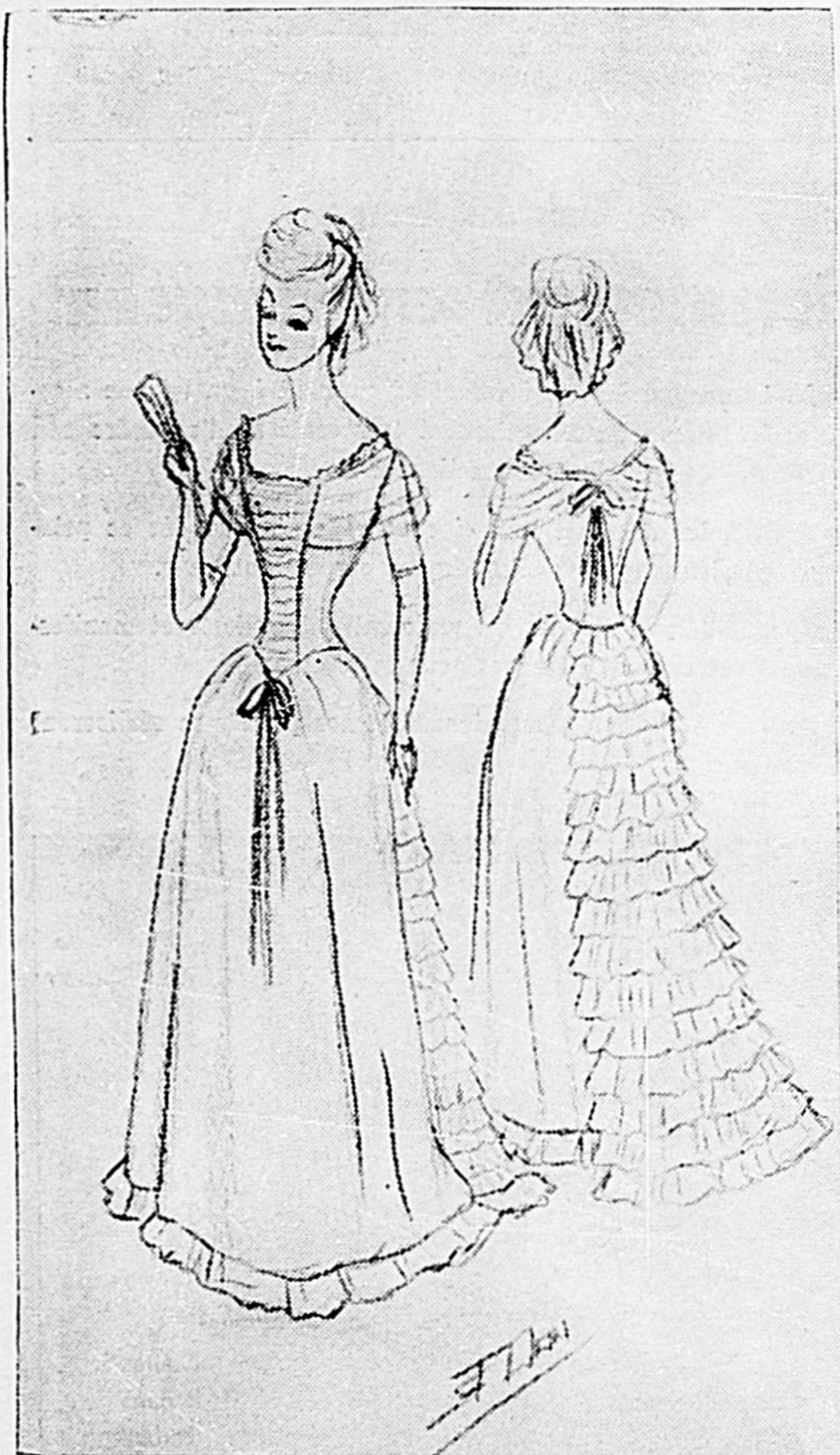
PATRON NO 1

Robe de soie à jupe cloche terminée par un volant. Taille froncée, terminée à l'avant par un noeud de ruban. Taille longue surmontée d'un diqué de petits volants de dentelle contournant les épaules jusqu'au dos. Petite collerette d'organza illusion partant du diqué au buste, se terminant au dos par un noeud de ruban. L'arrière de la taille supporte une légère traîne à volant d'organza. Le port de la menotte et de l'éventail est de mise. Coiffure montante à forme de rose drapée d'un frison de dentelle. Les toilettes sont portées avec guèpière et jupon à volants.