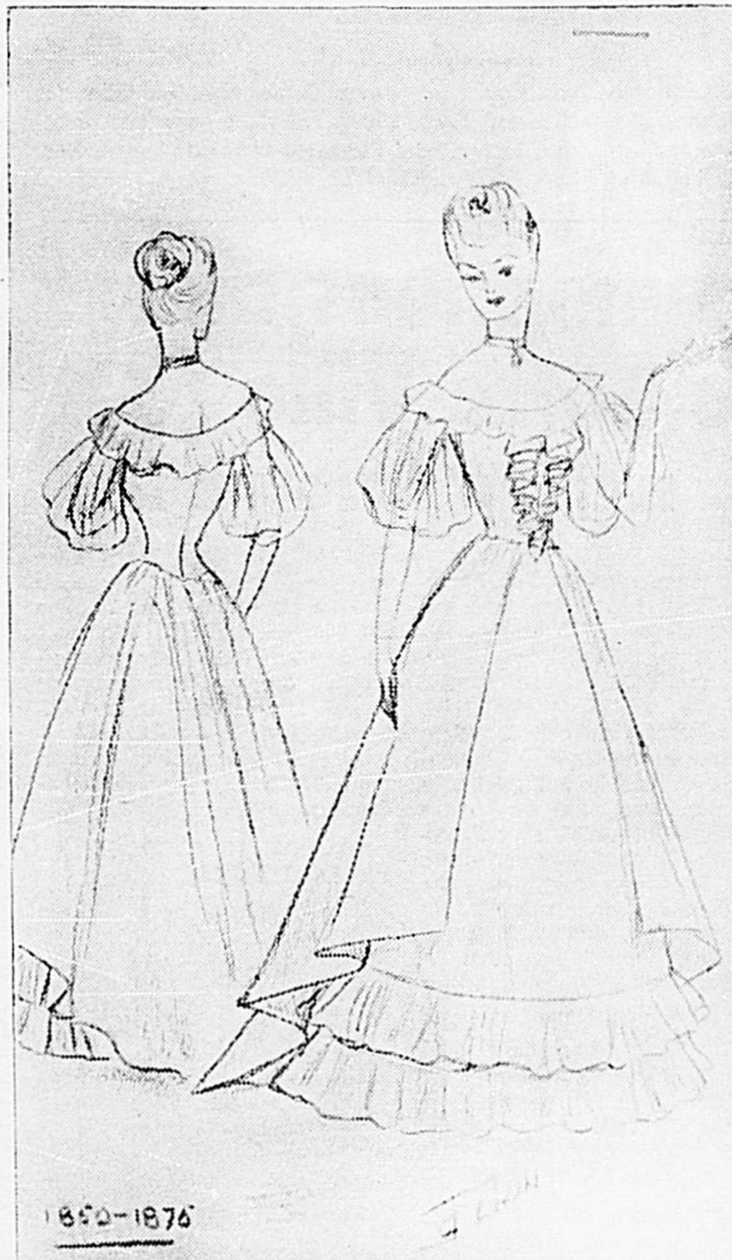
PATRON NO 2

Robe de soie à jupe cloche terminée par un volant. Taille froncée, terminée à l'avant par un noeud de ruban. Taille longue surmontée d'un diqué de petits volants de dentelle contournant les épaules jusqu'au dos. Petite collerette d'organza illusion partant du diqué au buste, se terminant au dos par un noeud de ruban. L'arrière de la taille supporte une légère traîne à volant d'organza. Le port de la menotte et de l'éventail est de mise. Coiffure montante à forme de rose drapée d'un frison de dentelle. Les toilettes sont portées avec guèpière et jupon à volants.