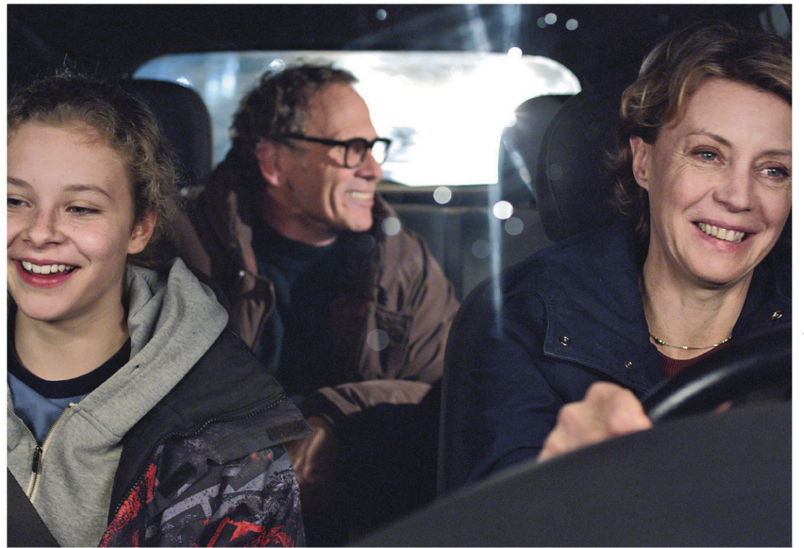
LES FILMS SÉVILLE