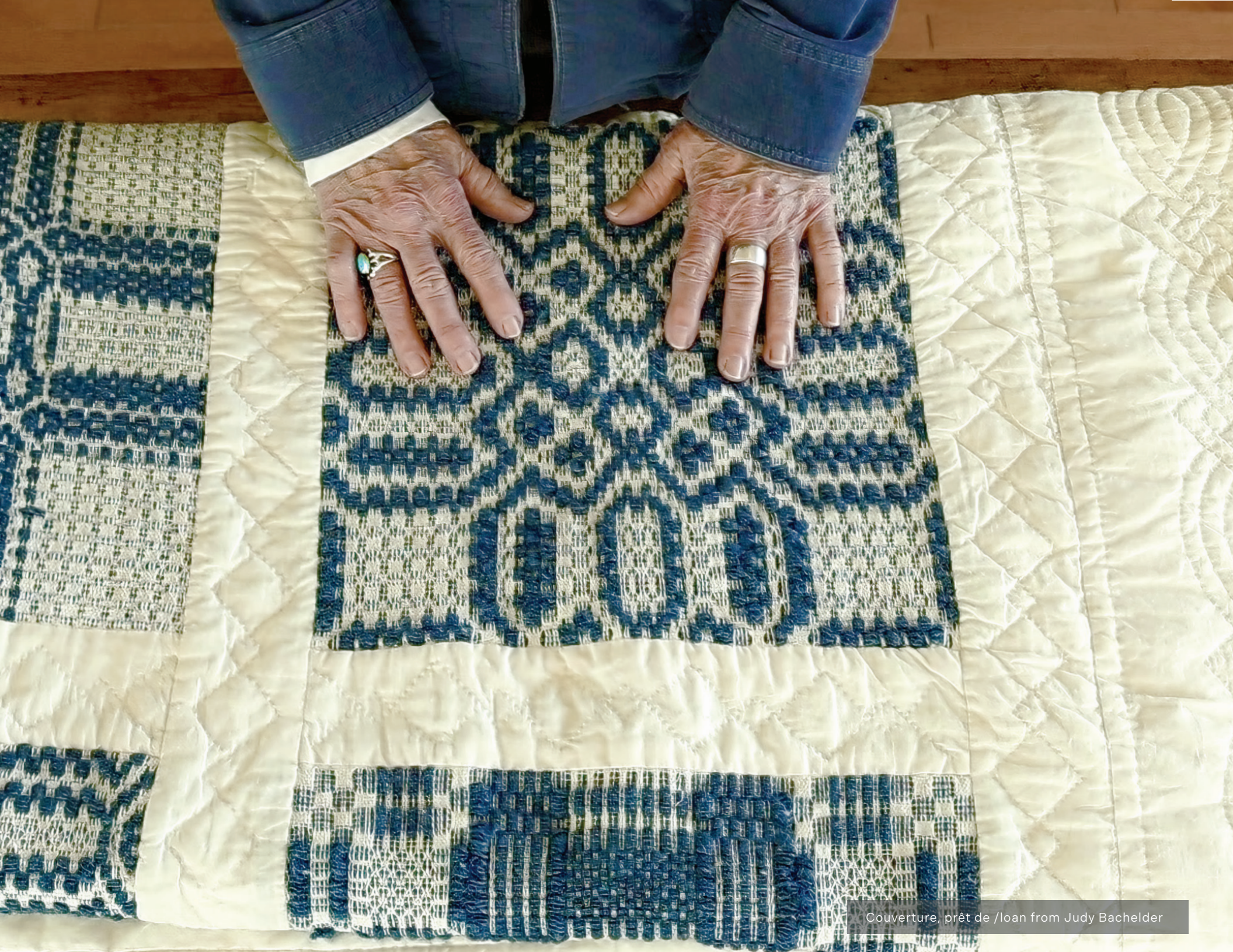
Couverture, prêt de /loan from Judy Bachelder