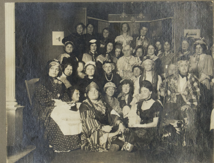
Photographie de groupe du Women's Institute de Beebe, 1970? / Beebe Women's Institute group photograph, 1970?

Their actions, centred around education, aim to create organized and supportive communities. By empowering women and engaging them in their villages, the local Women's Institutes have helped shape and develop the Stanstead region.