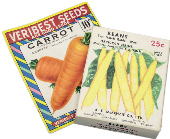
Semences, prêt du Women's Institute of Stanstead North / Seeds, loan from the Women's Institute of Stanstead North

Between 1917 and 1999, the School Fair was a major event in the calendar of the region's Women's Institutes. For one day, a number of competitions were organized according to pre-planned themes: cooking, sewing, herbarium, dance and running, among others. The main aim, however, was to teach the basics of agriculture. The women distributed vegetable and flower seeds to the schoolchildren in the spring, whose harvests were celebrated at the end of the summer at the school exhibition.