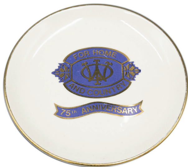
Assiette commémorative, prêt du Women's Institute of Stanstead North / Commemorative plate, loan from the Women's Institute of Stanstead North

Les activités organisées par les femmes sont rythmées par le calendrier agricole et social. Les paniers de la Saint-Valentin, le thé de la Saint-Patrick, la parade de la Fête du Canada et les fêtes de Noël sont des temps particulièrement importants. Plusieurs levées de fond sont aussi organisées. Jusqu'à très récemment, la tenue du Salon de thé lors de l'Exposition agricole d'Ayer's Cliff constituait l'événement le plus important de l'année. Les différentes branches s'y rassemblaient et organisaient des compétitions d'artisanat.