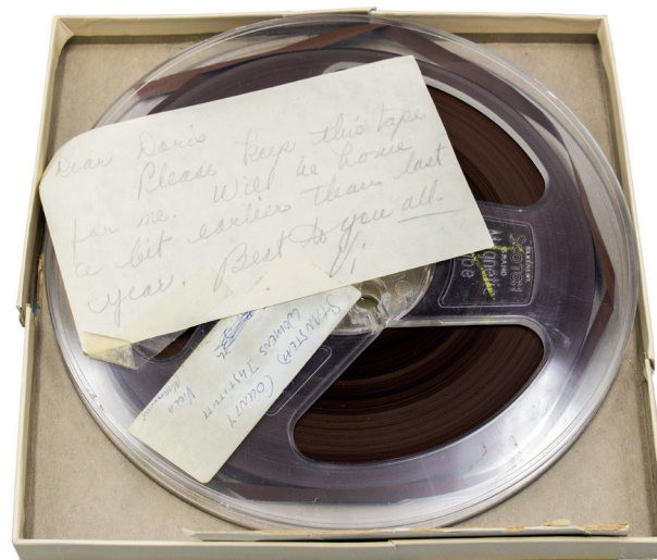
Bande magnétique des émissions de radio de Viola Moranville, Collection du Musée Colby-Curtis / Magnetic tape of Viola Moranville's radio broadcasts, Colby-Curtis Museum Collection

The activities organized by the women are punctuated by the agricultural and social calendar. Valentine's Day baskets, the St. Patrick's Day tea, the Canada Day parade and Christmas celebrations are particularly important. Several fundraising events are also organized. Until very recently, the most important event of the year was the Ayer's Cliff Fair Tearoom. There, the various branches got together and held craft competitions.