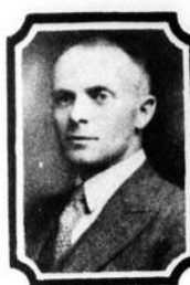
Hon. J. Adéard Godbout ministre.