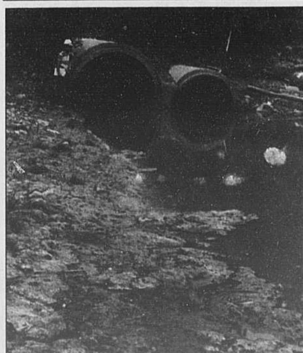
Les effluents non traités sont en voie de devenir chose du passé.

■ Lire aussi en page A 5: Une stratégie pathétique