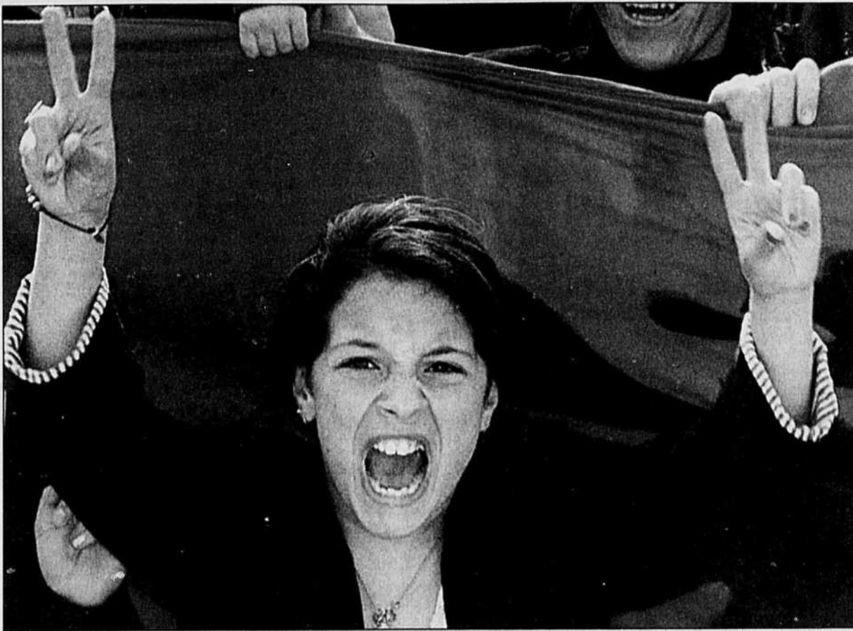
Plus de 10 000 Albanais ont manifesté hier à Tirana pour appuyer les frappes de l'OTAN en Yougoslavie.

■ L'intervention militaire de plus en plus critiquée