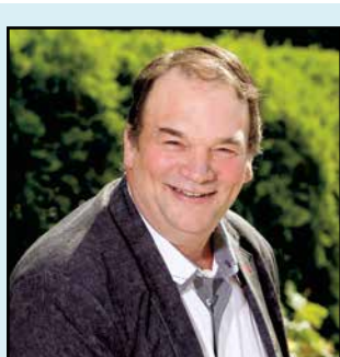
PAR SERGE BEAULIEU PRÉSIDENT