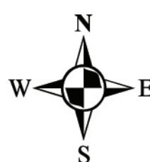
CARTE 3 Territoires forestiers internes et externes du Parc national du Mont-Orford

Source: Cartes écoforestières du MRN Québec Carte de base: Fichiers numériques (4) de la carte de base 1:20 000 du Ministère des Ressources Naturelles du Québec & Fichier numérique des aires protégées de la WCPA 2005 Système de référence géodésique: NAD83 Projection Transverse Mercator Équidistance des courbes: 10 mètres