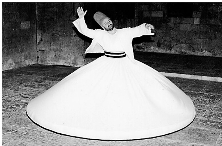
Le Cercle de l'extase...