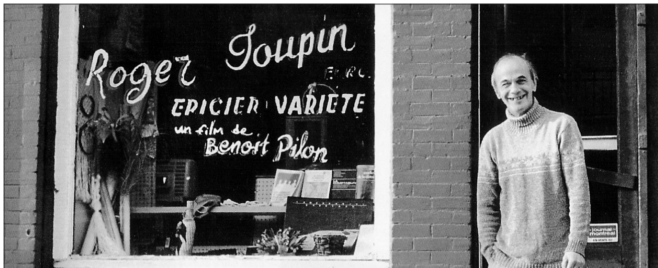
Le cinéaste Benoît Pilon, qui habite en face de Roger Toupin Épicier Variété, a été intrigué par ce personnage. Il a décidé d'en faire le héros de son film.

Cinéma Parallèle: 15h, 19h15 L'ÉCLIPSE Cinémathèque québécoise (salle Claude-Jutra): 20h30 L'INVASION (1775-1975) suivi de ON L'APPELAIT CAMBODGE Cinémathèque québécoise (salle Claude-Jutra): 18h30 LOST IN TRANSLATION Cinéma du Parc (1): 15h15, 17h15, 19h15, 21h15 PARTY MONSTER Cinéma du Parc (2): 19h30 THE GOONIES Cinéma du Parc (3): 21h30 THE WEATHER UNDERGROUND Cinéma du Parc (3): 17h30 THE EYE Cinéma du Parc (2): 19h45, 21h45 MUSIQUE SALLE WILFRID-PELLETIER DE LA PLACE DES ARTS Orchestre Symphonique de Montréal. Dir. Jacques Lacombe. Emanuel Ax, pianiste. Images de la Révolution (Héty), Concerto pour piano K. 503 (Mozart), Sinfonia seviliana (Turina), Iberia (Debussy): 20h