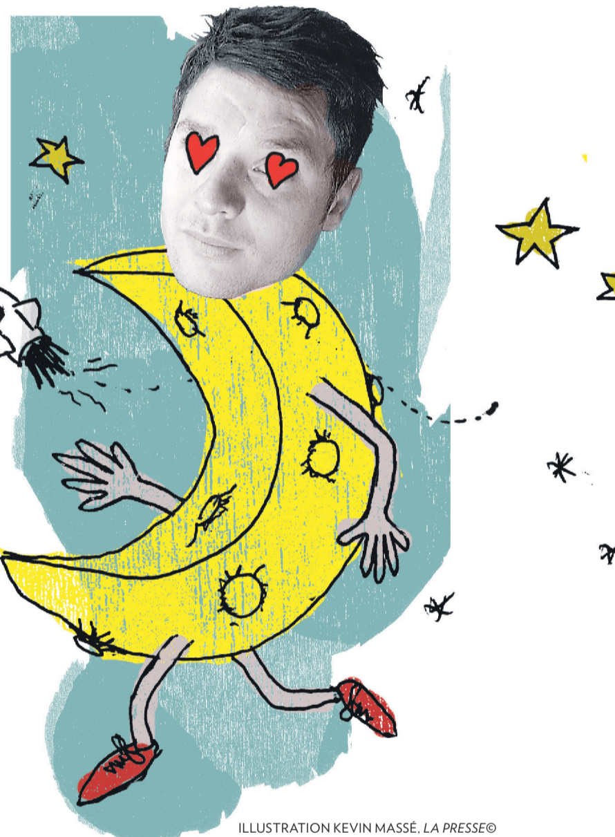
ILLUSTRATION KEVIN MASSÉ, LA PRESSE©