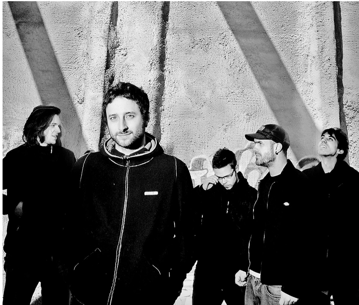
Après le festin de Malajube, c'est au tour de Karkwa de nous en mettre plein les oreilles et les yeux.

Le lendemain risque d'être le concert le plus aventureux de la série. Le concept Sons & images exige à la fois la précision d'une mise en scène qui s'appuie sur des projections, mais aussi sur des lectures, instrumentales, des chansons du groupe. « Les fans vont reconnaître nos chansons, mais ils vont devoir y penser un peu plus longtemps ». Karkwa, version dub, littéralement. Un beau trip, à entendre