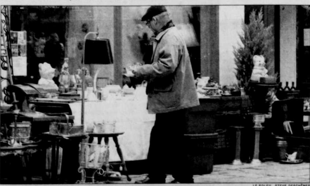
Les antiquaires de la rue Saint-Paul célèbrent leur 40 e anniversaire cette fin de semaine. Pour souligner l'événement, ils envahissent jusqu'à aujourd'hui les trottoirs de l'artère commerciale pour présenter leurs produits.