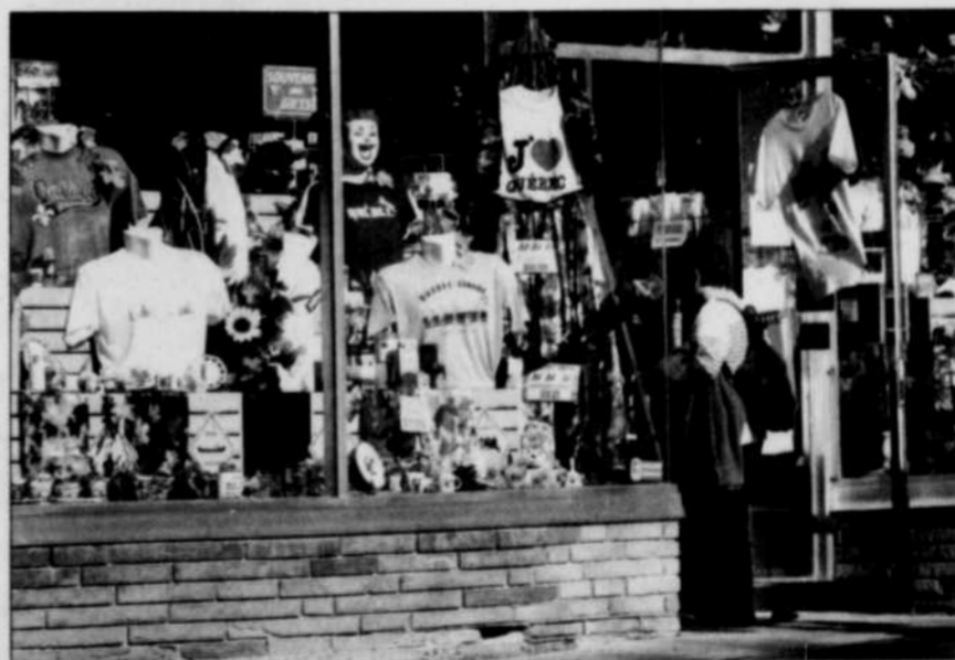
Certaines «trappes à touristes» du Vieux-Québec présentent des façades qui auraient besoin d'une sérieuse restauration.

me de sa beauté et de ses attraits. Le tourisme est en train de l'étouffer. Sur