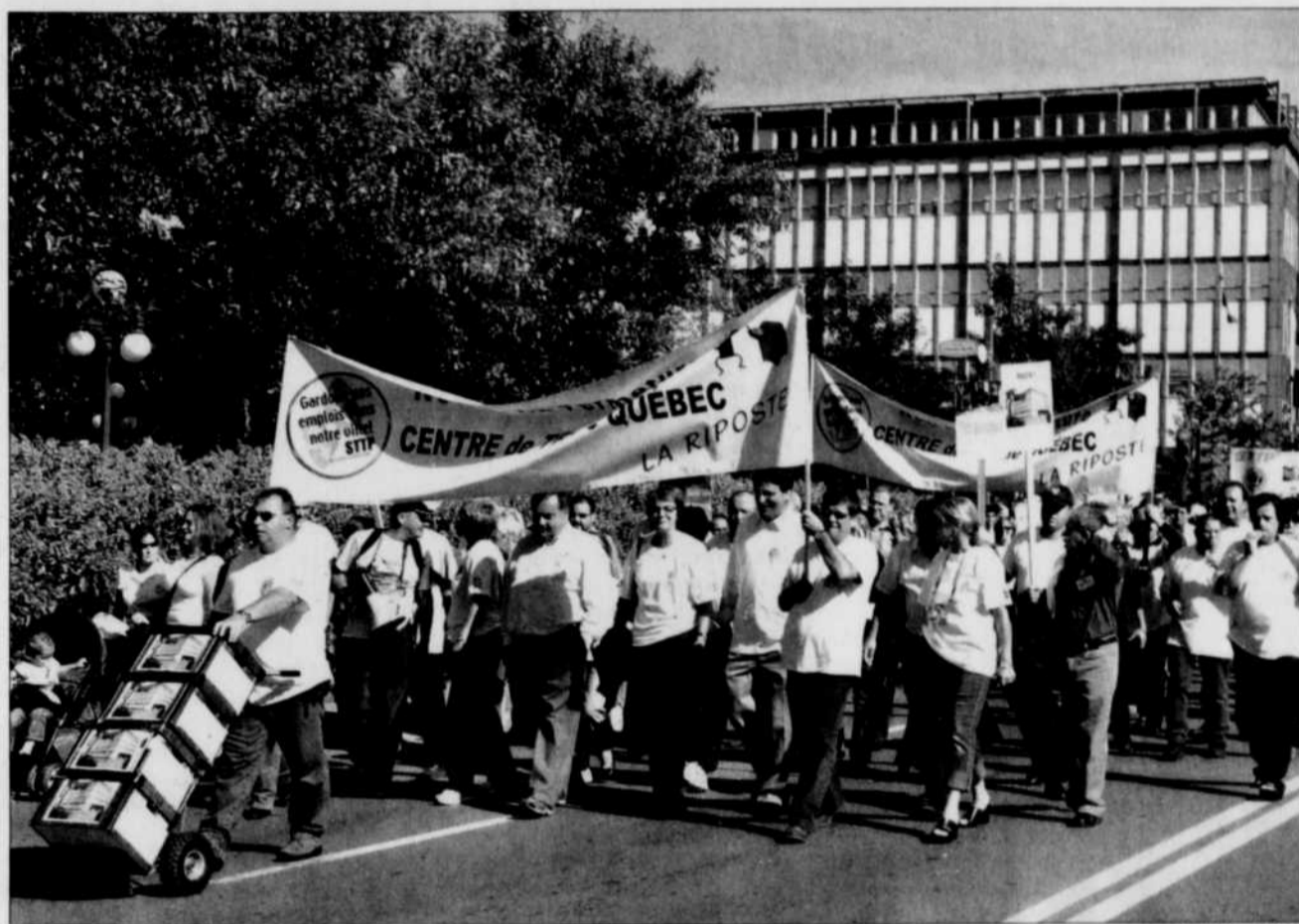
L'annonce par Postes Canada de la fermeture définitive du centre de tri de Québec a suscité l'indignation de plusieurs lecteurs.