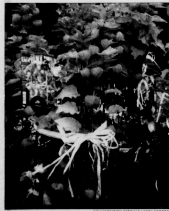
Juste à temps pour l'Halloween, des potées de lanternes chinoises.

Quelqu'un a eu l'idée géniale de mettre cette plante en pot, la solidifiant avec du raphia puisque toute seule elle n'a aucun tonus, et de la mettre en vente comme plante de l'Halloween sous le nom de « Livin, Lantern » (lanterne vivante). Quelle idée géniale ! Les lanternes papyracées qui recouvrent les petits fruits sont orange vif, exactement la bonne couleur pour la saison. On dirait des petites citrouilles ! De plus, les « lanternes » séchent très bien, donc même le pire pouce noir aura du succès avec cette plante, car elle est aussi jolie morte que vivante ! Le seul hic que j'ai trouvé à cette idée est que les plantes que j'ai vues dans un magasin à grande surface de la région avaient l'air de la chienne à Jacques : il faut croire que pendant le transport on les a brassées passablement ! Sans doute y a-t-il de meilleurs spécimens ailleurs dans la région.