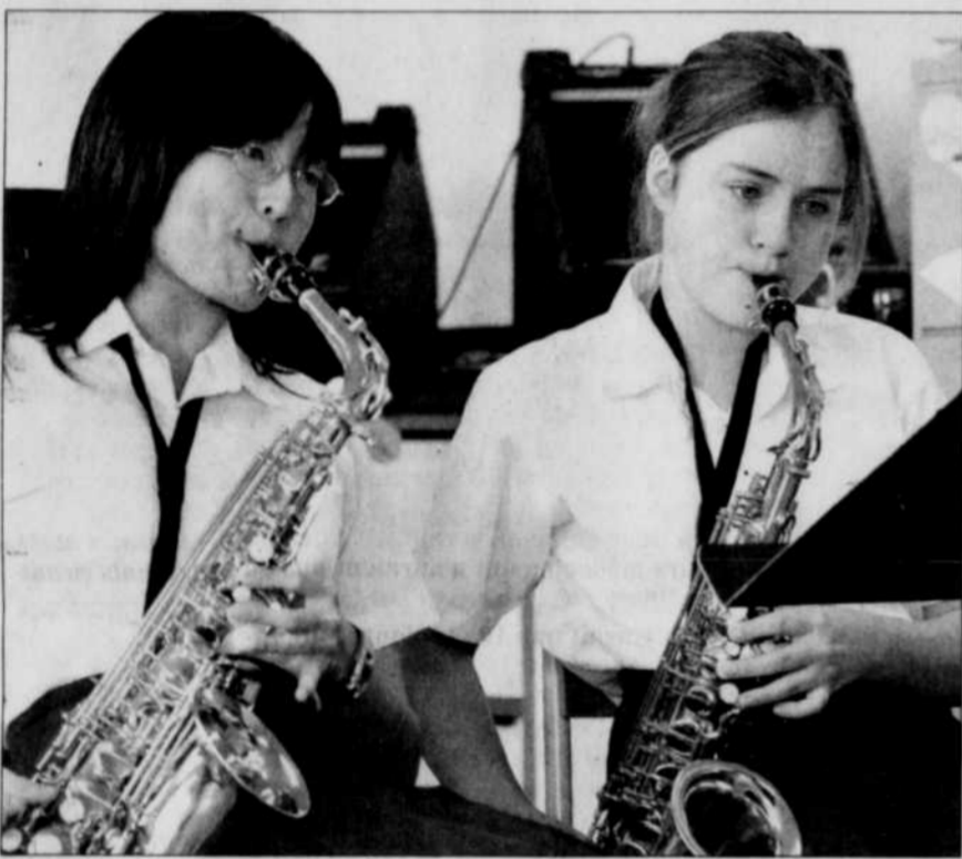
À leur entrée dans la Maîtrise, les plus jeunes reçoivent une formation de base en chant et s'initient, en petits groupes, à divers instruments.

Votre classe ou votre école prépare une activité spéciale, une sortie, une fête, un spectacle, une action communautaire, une classe verte ou blanche, etc. Prévenez-nous à redaction@lesoleil.com Chaque semaine, nous publierons un reportage réalisé dans une école primaire ou secondaire.