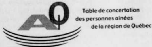
Table de concertation des personnes aînées de la région de Québec

Il a entre autres montré du doigt quelques problèmes qui devront être résolus dans l'arrondissement historique du Vieux-Québec : la prolifération des boutiques de souvenirs ; l'envahissement des autocars ; la location illégale à la semaine de logements et de résidences ; la disparition des commerces de nécessité courante.