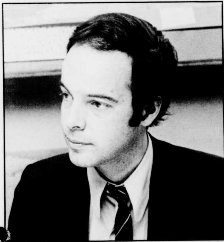
Pierre NADEAU, animateur.