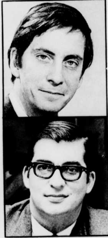
De g. à dr.: Bernard DEROME, Gilles MOREAU, Claude-Jean DEVIRIEUX et René MAILHOT.