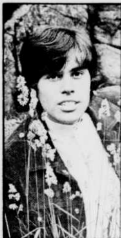
Le chanteur BRUCE interprétera «Je ne pense qu'à toi».