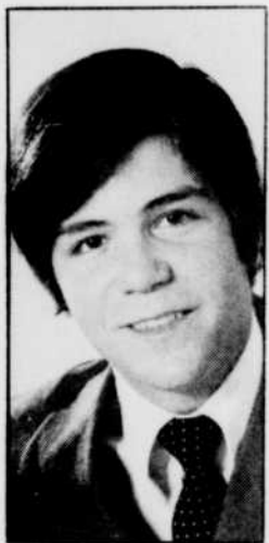
Le jeune chanteur PAPILLON interprétera une primeur au «Donald Lautrec «chaud»».