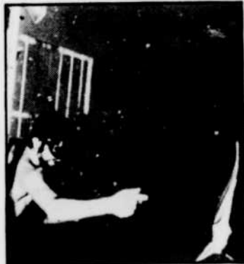
... animal étrange

La Calypso est équipée du matériel océanographique le plus