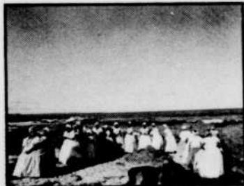
On y danse, on y danse...

La misère, à Bahia, nous la retrouvons chez les «Alagados»,