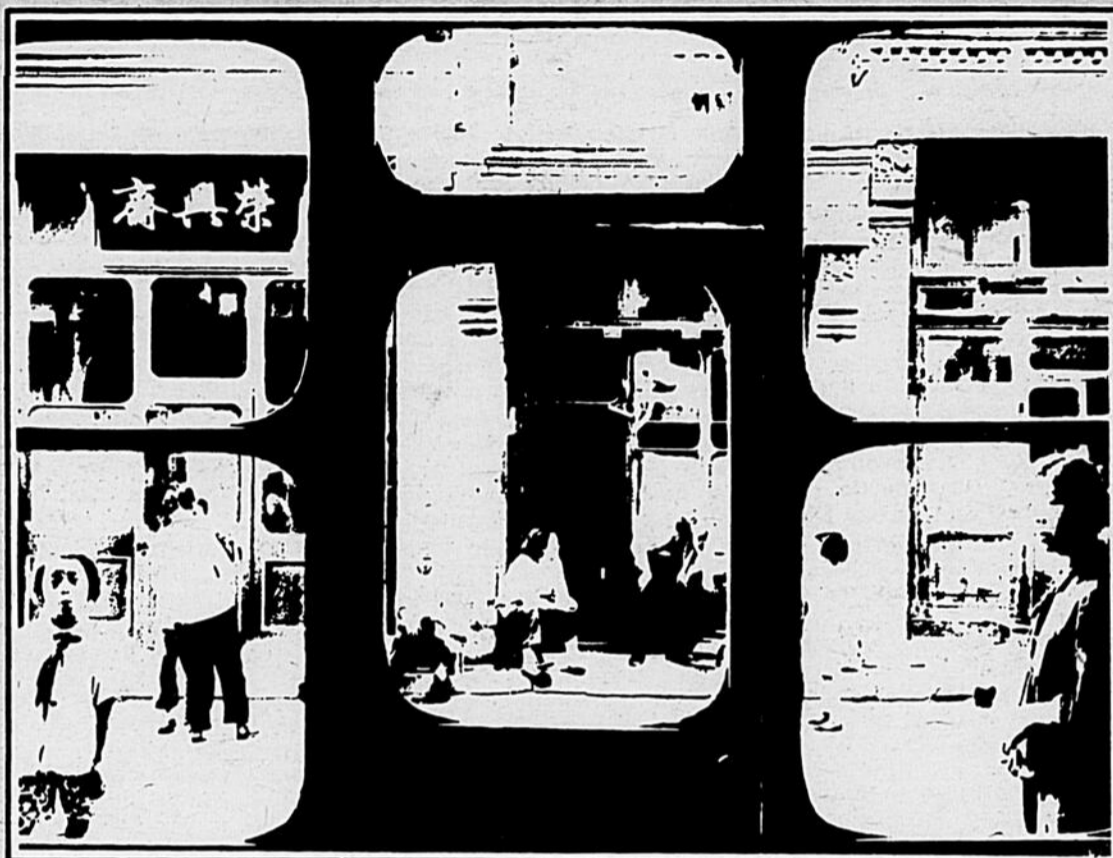
Péking, 1965. [ci-dessus], Péking, 1971. [ci-dessous]

Edgar Snow et sa femme Nym Wales [Helen Foster Snow] rencontrèrent les Communistes chinois dans leur retranchement en 1936 et 1937. De ces moments dits historiques, nous pouvons voir une série de photos de Mao et de ses soldats. Ceux qui croient que ce sont les têtes d'affiche qui font l'histoire considèrent que ces photos sont d'un intérêt inestimable. En fait, nous n'apprenons pas grand