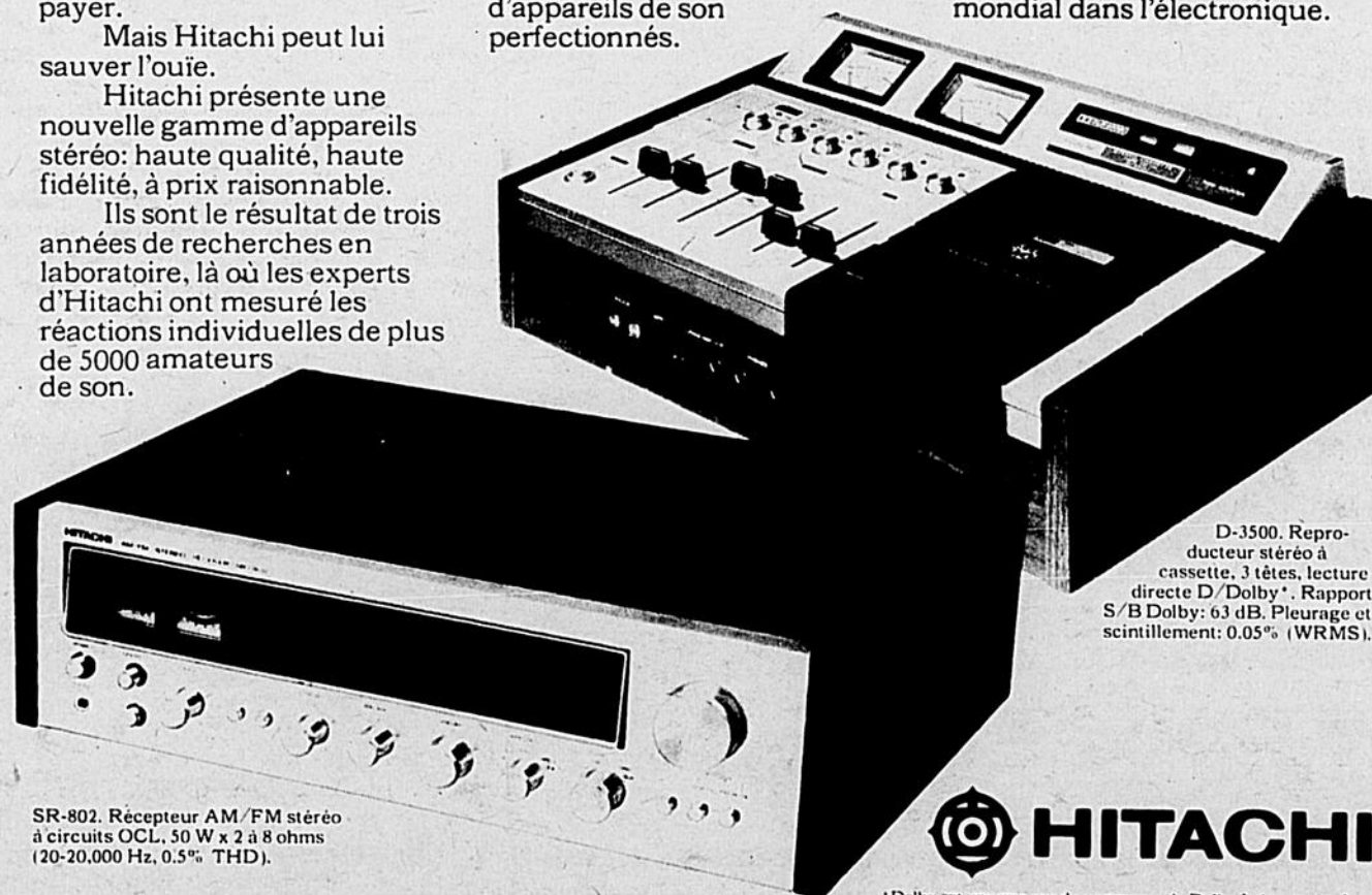
SR-802. Récepteur AM/FM stéréo à circuits OCL. 50 W x 2 à 8 ohms (20-20.000 Hz, 0.5% THD).

Une réalisation à prix raisonnable, du genre qui a fait de Hitachi un chef de file mondial dans l'électronique.