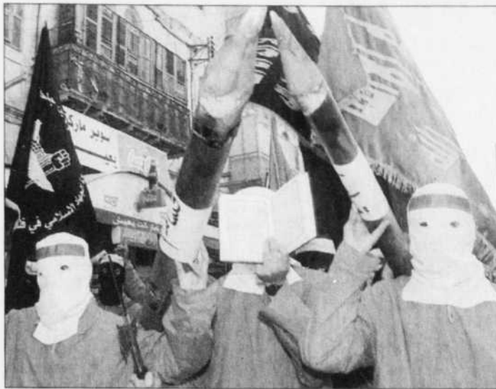
Manifestation du groupe islamiste Hamas à Naplouse

La cour de l'école arabe de Sour al-Baher, à Jérusalem-Est, était jon-