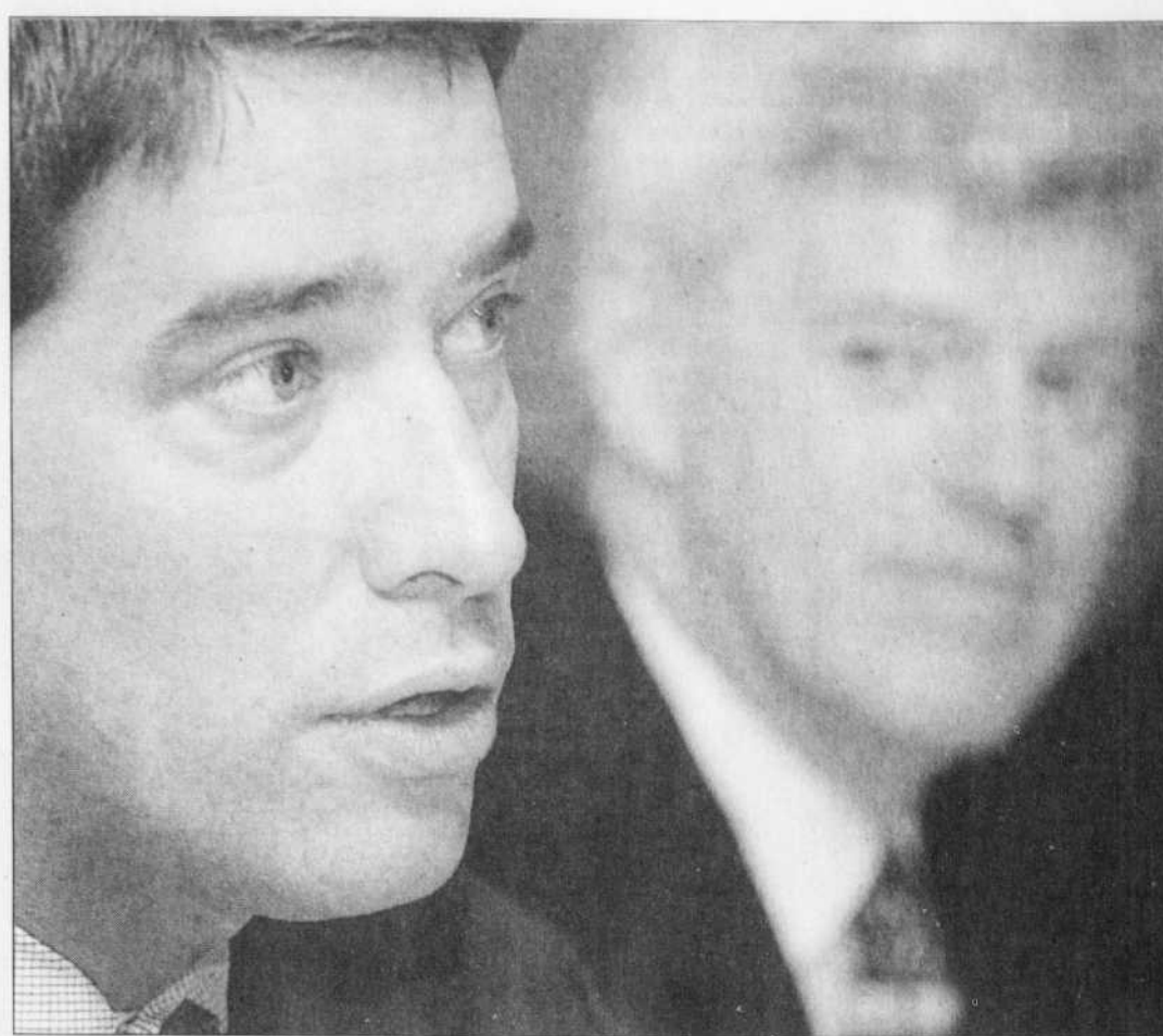
Le ministre d'État aux Affaires municipales, André Boisclair, et le vice-premier ministre canadien, John Manley, ont confirmé l'implication financière de leur gouvernement respectif pour améliorer l'accès au logement.

Les représentants gouvernementaux évaluent à 84 000 $ le coût de chaque appartement neuf de type social. Pour ces unités, l'aide financière gouvernementale maximale est de 75 % (environ