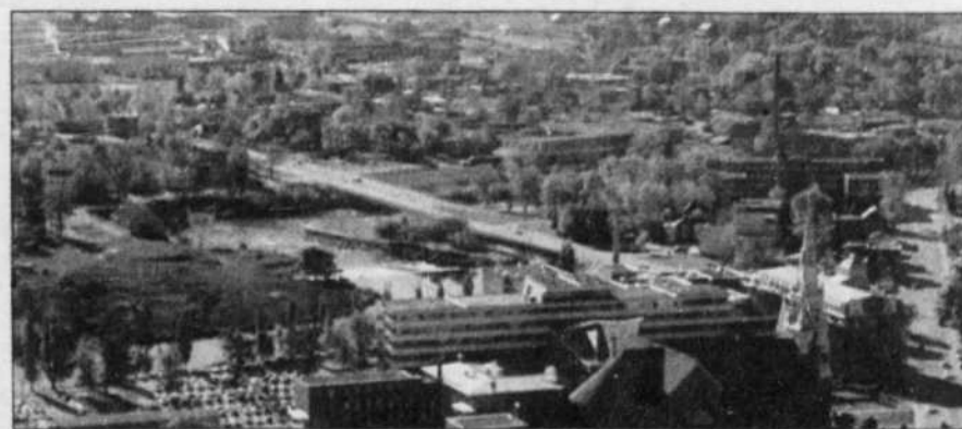
ARCHIVES LE DEVOIR

La ville de Joliette est parmi la demi-douzaine de municipalités qui pourraient encore se retrouver au centre de projets de fusion.