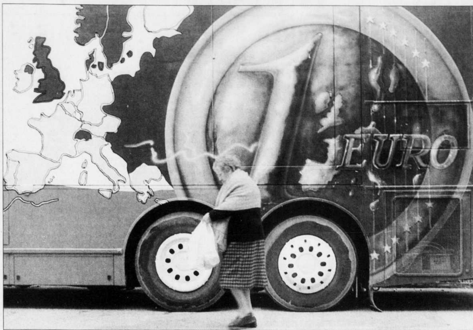
Une femme croise un autobus décoré aux couleurs de l'euro dans le village andalou d'Umbrete. C'est précisément en vue d'assurer une prospérité nécessaire à l'épanouissement de sa diversité que l'Europe a institué le marché et la monnaie uniques.