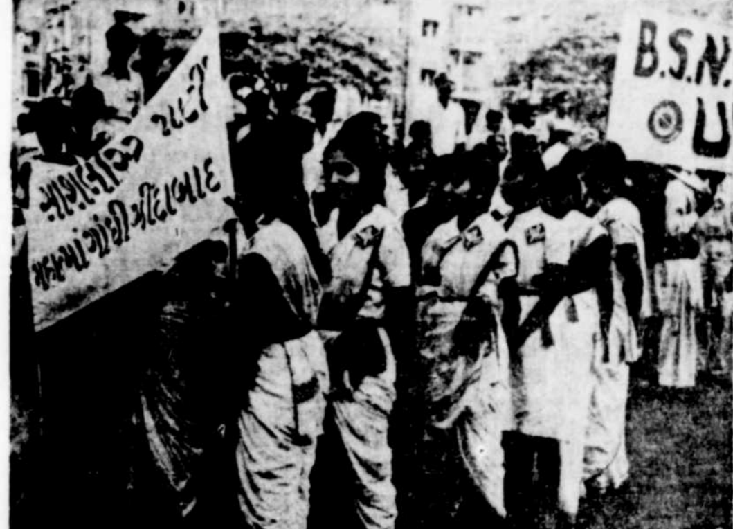
Des foules immenses se sont réunies à Bombay lorsque M. Gandhi mit fin à son 15ème jeûne en 35 ans durant la sixième journée de son dernier jeûne. On calcule qu'un million et quart de photos de Gandhi furent distribuées par les membres du défilé et fixées aux habits des sympathisants dont la foule s'étendait sur un parcours de sept milles de long et qui mirent quatre heures à défilé. La procession s'arrêta pendant quelque temps au plein cœur de la ville musulmane de Bombay et Hindous et Musulmans s'embrassèrent dans la rue. Les femmes qui l'on aperçut sur cette photo portaient des piacards.

Les exportations de hareng frais ont passé de 43,594 tonnes, pendant la période de janvier à septembre 1946, à la valeur totale des produits de poisson et de produits de poisson de 50 millions de kroner, contre 50 millions pendant la période correspondante de 1945.