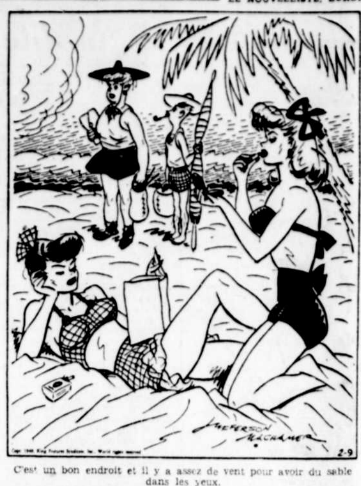
C'est un bon endroit et il y a assez de vent pour avoir du sable dans les yeux.