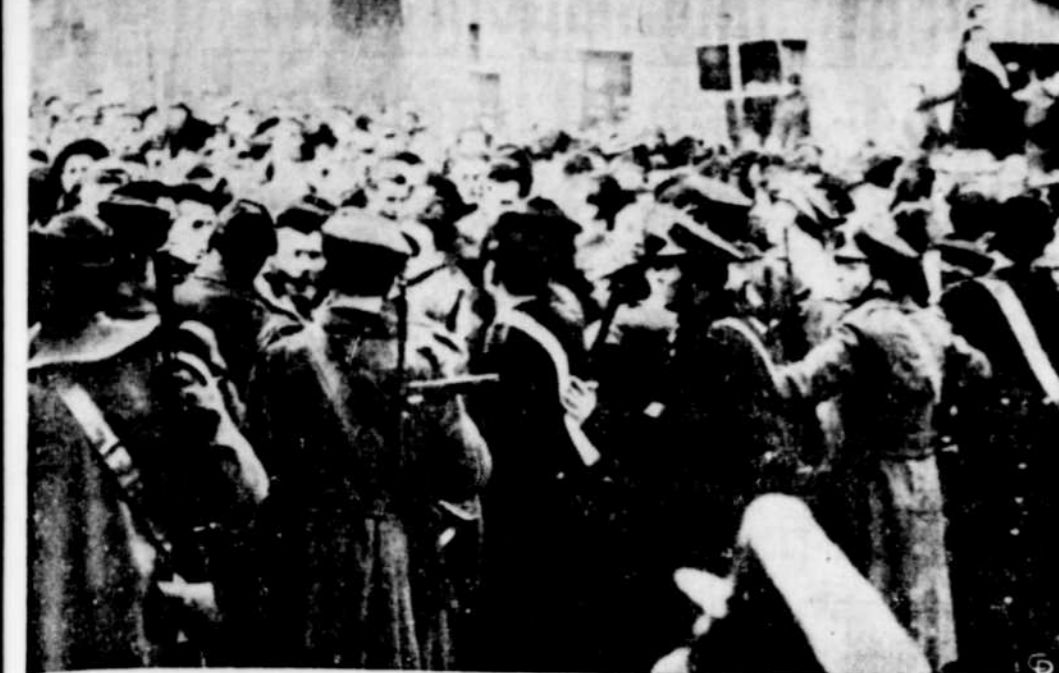
La police et les troupes ont dû montrer de la fermeté pour contrôler les chômeurs manifestants de Milan, Italie, qui demandaient du travail. A Florence il s'agissait de grévistes dirigés par des communistes. Lors d'un conflit entre grévistes et policiers il y eut 70 blessés.