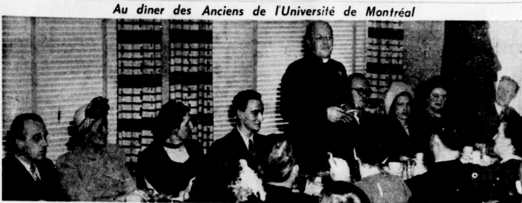
Au dîner des Anciens de l'Université de Montréal, au restaurant Pénin-Mass, un meeting des Anciens et des étudiants...