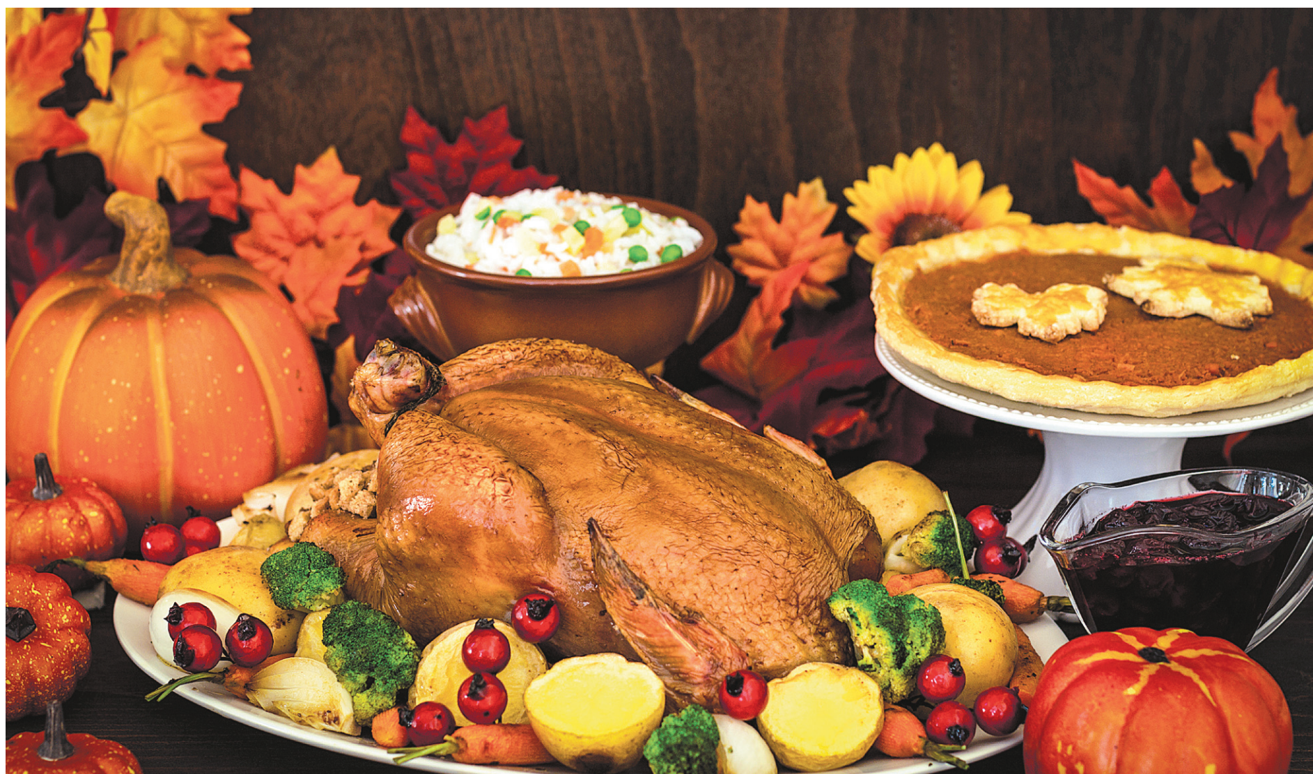
Le temps de l'Action de grâce voit se perpétuer la tradition de servir de la dinde, un potage à la courge et une bonne tarte aux pommes ou à la citrouille.

Il est bien loin, le temps où il fallait à tout prix mettre en conserve les légumes racines, placer en réserve les patates et les rabioles et se dire alors qu'on en avait pour six mois jusqu'aux récoltes du printemps. L'ouverture du monde sur l'agroalimentaire a véritablement changé la donne. On trouve de tout, toute l'année.