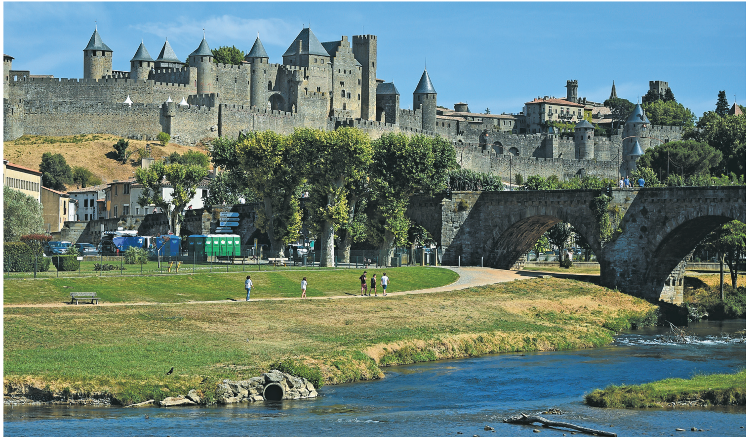
La citadelle de Carcassonne, dans le sud-ouest de la France. La cité fortifiée figure sur la liste du Patrimoine mondial de l'UNESCO.

«Même si nous nous sommes beaucoup attachés à Vancouver au début et à la fin du voyage, ce fut dans l'ensemble un voyage axé sur la nature et les grands espaces. Je ne m'étendrai pas sur la beauté et la diversité des sites