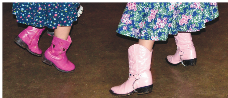
Les traditions sont transmises de génération en génération sur le circuit de la Crooked Road.

En 1968, June Carter devient l'épouse de Johnny Cash. La famille Carter demeure une icône sacrée du country traditionnel américain dans le sud-ouest de la Virginie. Et pour sauvegarder ce statut, on a créé un musée et salle de spectacle qui raconte l'histoire de la famille.