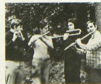
Le Quatuor Arcadie

Cette émission est réalisée par Jacqueline Léveillé. Présentateur: André Hébert.