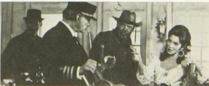
Les Quatre Mercenaires d'El Paso

A certains moments, le récit se fait plutôt chaotique, mais la mise en scène comporte juste ce qu'il faut d'élan pour soutenir le rythme... du rire.