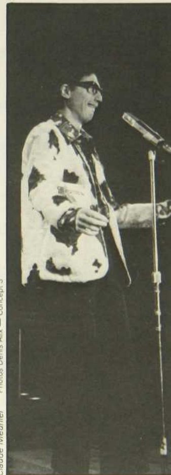
Claude Meunier Photos Denis Alix — Concept 3