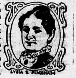
LYDIA E. PINKHAM

L'instruction qui suit est dogmatique et je crains de n'avoir pas réussi à la mettre assez simplement à la portée du grand nombre. Si vous estimez qu'elle serait malaisément comprise de votre auditoire, il vous sera loisible d'en prendre les idées essentielles et d'en donner à vos fidèles un commentaire plus explicite et plus vivant. Cependant, gardez-vous de prononcer a priori que les grandeurs du dogme catholique ne sont pas pour la foule. Pour qui, de grâce, saint Jacques, saint Pierre, saint Jean destinaient-ils leurs Epîtres? Toute âme baptisée porte en elle des capacités d'intelligence qui demandent satisfaction, et que la doctrine chrétienne est destinée à nourrir. N'avez-vous pas été souvent frappés de voir combien les petits enfants que vous préparez, dès les sept ou huit ans, à leur première Communion, se montraient ouverts, quand ils avaient le cœur pur, aux vérités les plus élevées du christianisme? Si l'ignorance, en matière religieuse, est parfois si désolante, la faute en est-elle toujours au peuple lui-même? "Quomodo credenti quem non audierunt?" disait saint Paul. "Quomodo autem audient sine predicante?" Comment voulez-vous que le peuple croie en Celui dont il n'a même pas entendu parler? Et comment entendrait-il parler de lui, si on ne le lui présente pas? Or, est-ce le prêcheur, que d'affirmer sa loi, d'annoncer ses promesses ou ses menaces, mais sans attirer vers l'adorable Mystère