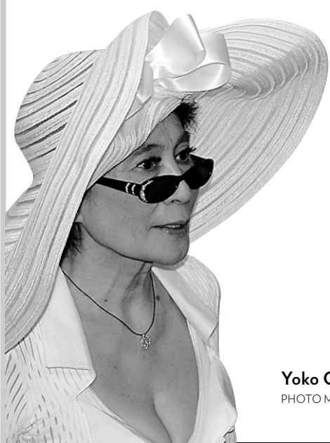
Yoko Ono