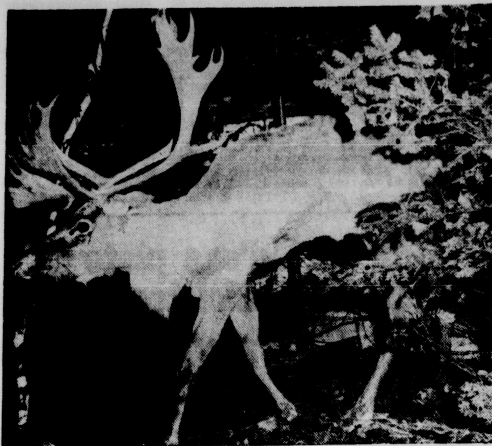
LA FAUNE CANADIENNE ET AFRICAINE à Sportorama '70 qui s'ouvre ce soir au Centre Marcotte de Trois-Rivières (arène dans la cour du Séminaire de Trois-Rivières). Ci-dessus, un caribou sortant du bois, caribou que la population pourra voir en visitant Sportorama '70.

Les amateurs auront aussi la chance de voir un film traitant sur la chasse aux oies et à des pêches miraculeuses. Donc, c'est un rendez-vous au kiosque de la Baie James et à Sportorama '70 au Centre Marcotte de Trois-Rivières à compter de ce soir.