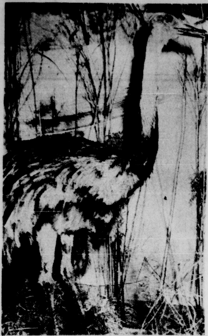
LES NOMBREUX VISITEURS attendus à Sportorama '70 pourront voir cette jolies autruche en se rendant au Centre Marcotte (cour du Séminaire de Trois-Rivières) à compter de ce soir jusqu'à dimanche soir. Cette autruche fait partie du kiosque de la faune canadienne et africaine à la grande exposition annuelle de vie au grand air en notre ville.

La grande exposition annuelle de vie au grand air et sportive