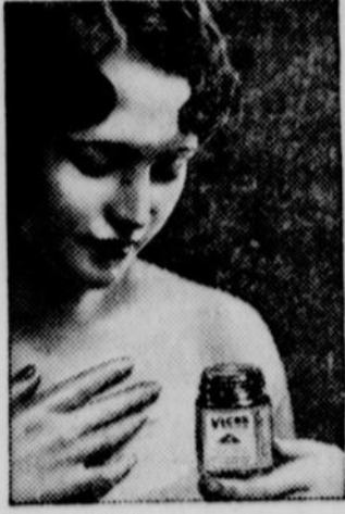
Mère! Les toux nocturnes des enfants peuvent être généralement enrayerées par une application de Vicks. Frictionnez vivement et couvrez d'une flanelle chaude.

Quand un rhume descend sur la poitrine, ne courez pas de risques. Mettez-vous au lit et commencez le traitement Vicks à double action. Frictionnez-vous vigoureusement la gorge et la poitrine avec du Vicks et couvrez-vous avec une flanelle chaude. Le soulagement s'obtient de deux façons: (1) Par stimulation — A travers la peau, comme un cataplasme, le Vicks fait sortir l'oppression et la douleur. (2) Par inhalation — Ses vapeurs médicamenteuses, qui dégagent la chaleur du corps, sont aspirées directement par les voies respiratoires. Pour augmenter l'effet stimulant, faites rougir la peau sur la gorge et la poitrine avec des serviettes humides chaudes avant d'appliquer le Vicks.