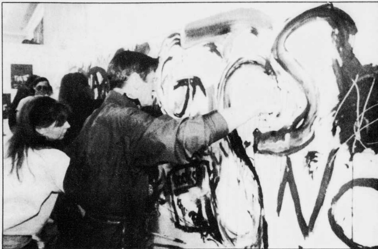
Dans une galerie d'art de Toronto, des artistes s'affairaient hier à réaliser une murale anti-TPS en guise d'appui aux sénateurs libéraux. Ceux-ci projettent d'exhiber «l'oeuvre» sur la colline parlementaire aujourd'hui.

«Rien ne prouve qu'elle ait été déposée», a-t-il déclaré.