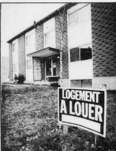
Le record canadien du plus haut taux d'inoccupation de logements, détenu par la région de Sherbrooke métropolitaine, soit 9,7 pour cent ou 2200 logements vides, se traduit par des hausses de loyer minimales.

Le taux de vacance donne une arme aux locataires... et les proprios sont inquiets