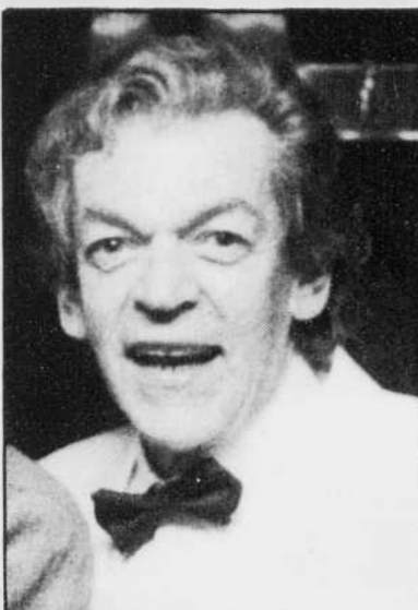
Emporté par un cancer à l'âge de 58 ans, le comédien Gaétan Labrèche bénéficiait de l'admiration de ses pairs.

La colonie artistique émue par le décès de Gaétan Labrèche