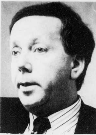
André Vallerand, ministre du Tourisme du Québec

Au cours des prochains mois, les efforts promotionnels du ministère