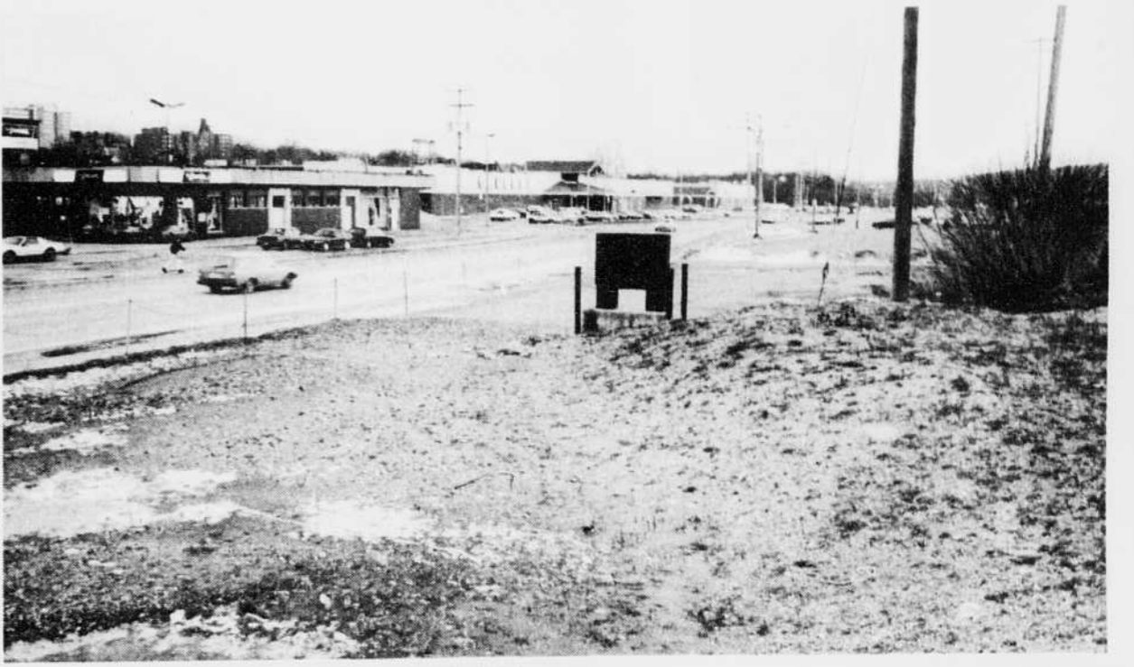
En vertu d'une entente hors cour, la Ville de Sherbrooke a acquis pour 630 000 $ une longue bande de terrain, située entre la rue des Grandes-Fourches Sud et les voies ferrées du Canadien Pacifique, en vue de réaménager le centre-ville.

«Je crois que ça intéressera la population et bien entendu les journalistes», a-t-il dit pour toute réponse.