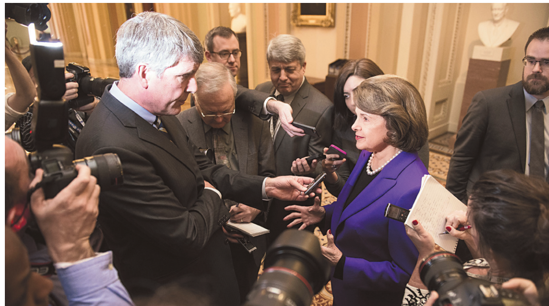
Dianne Feinstein a dû répondre à de nombreuses questions des journalistes mardi.

Le pays reconnaissait jusqu'à présent quelque 400 morts ou disparus pendant