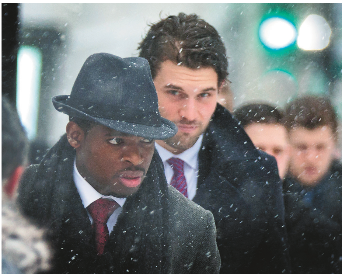
Les joueurs du Canadien, menés par P.K. Subban, ont rendu un dernier hommage au numéro 4.

P.K. Subban , défenseur du Canadien — « C'est ce à quoi je m'attendais. Un témoignage a rappelé qu'on ne disait pas