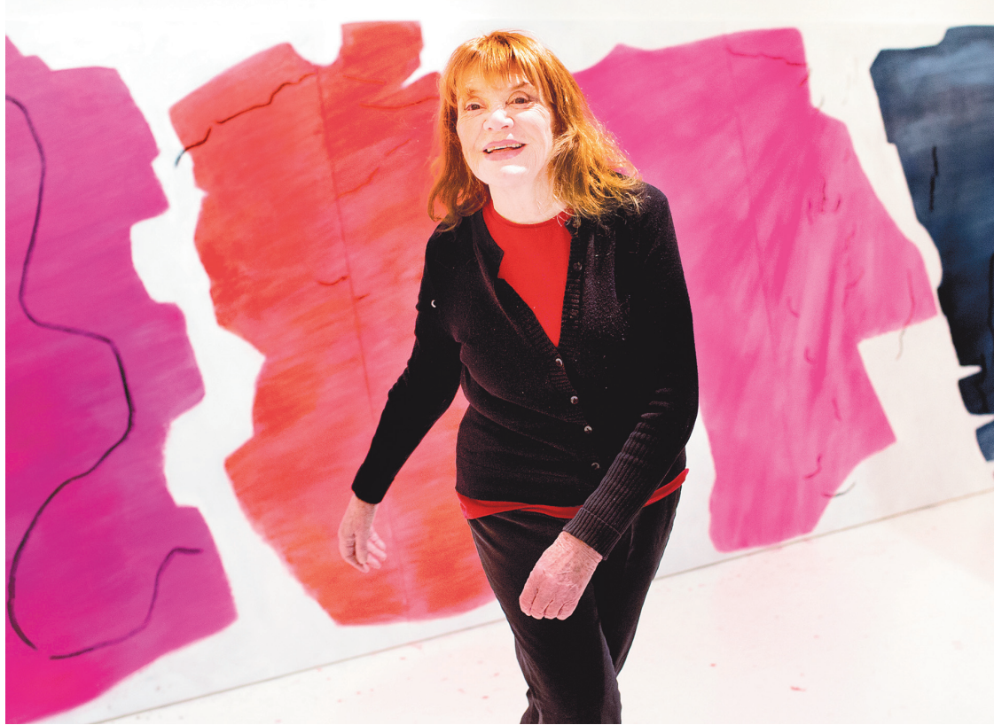
La danseuse, sculptrice, peintre et signataire de Refus global pose dans son atelier.