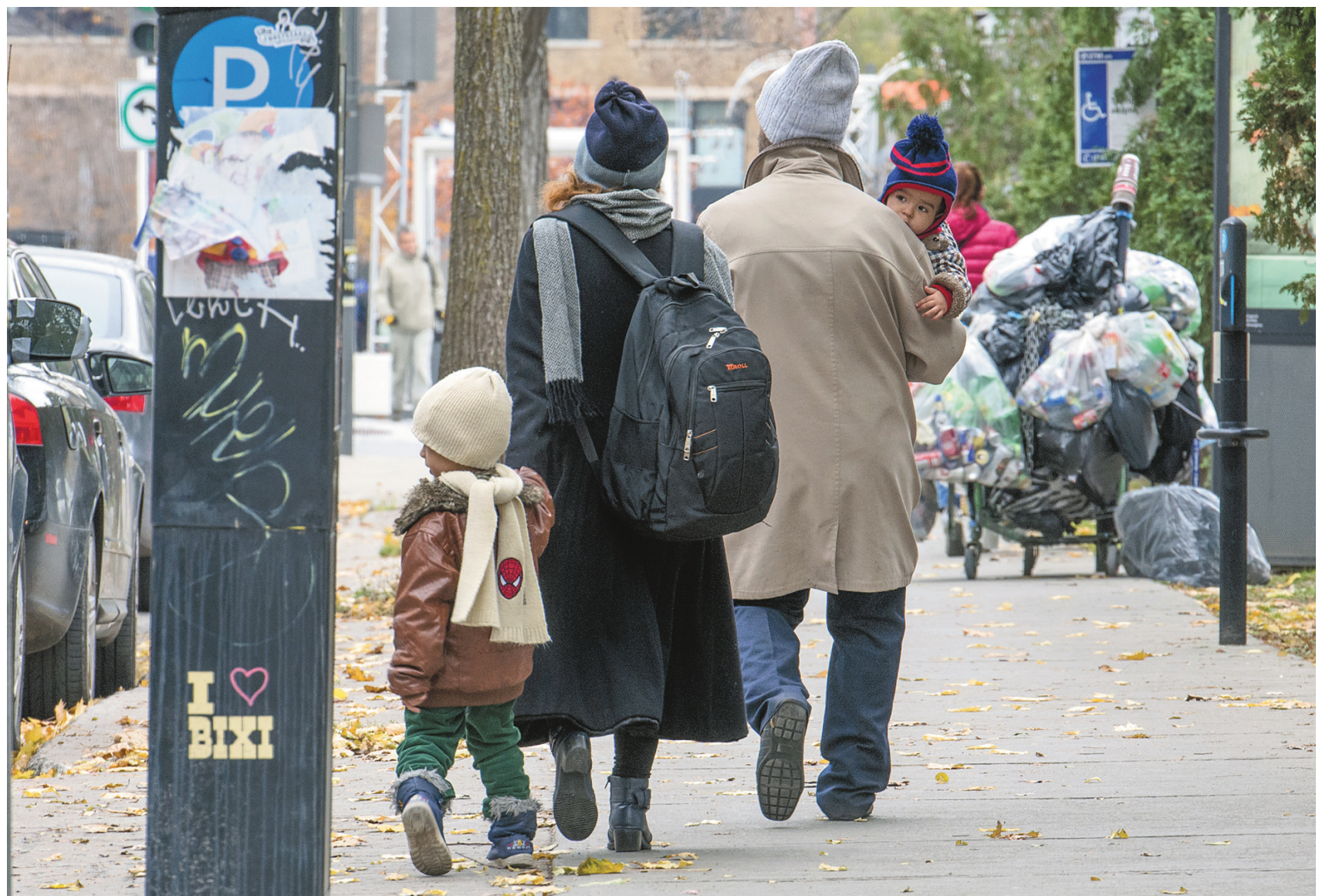
MICHAËL MONNIER LE DEVOIR

♦ ♦ ♦ Au Canada, les dépenses sociales représentent 17% du PIB cette année. Au sommet de 2009, cette proportion s'élevait à 18,5%, nous disait toujours l'OCDE le mois dernier, qui constatait: « Ces dernières années, les dépenses allouées aux allocations de chômage, de maladie ou autres aides sociales ont connu des baisses importantes au Canada, en Allemagne, en Islande, en Irlande ou encore au Royaume-Uni. »