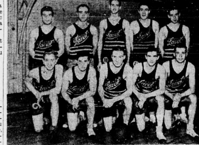
Voici l'équipe du C. E. O. C. qui dispute le championnat de ballon-panier chez les Canadiens français contre la Païestre Nationale.