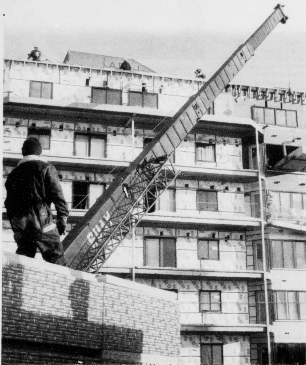
LE SOLEIL, RAYNALD LAVOIE

■ La construction non résidentielle Page G 3