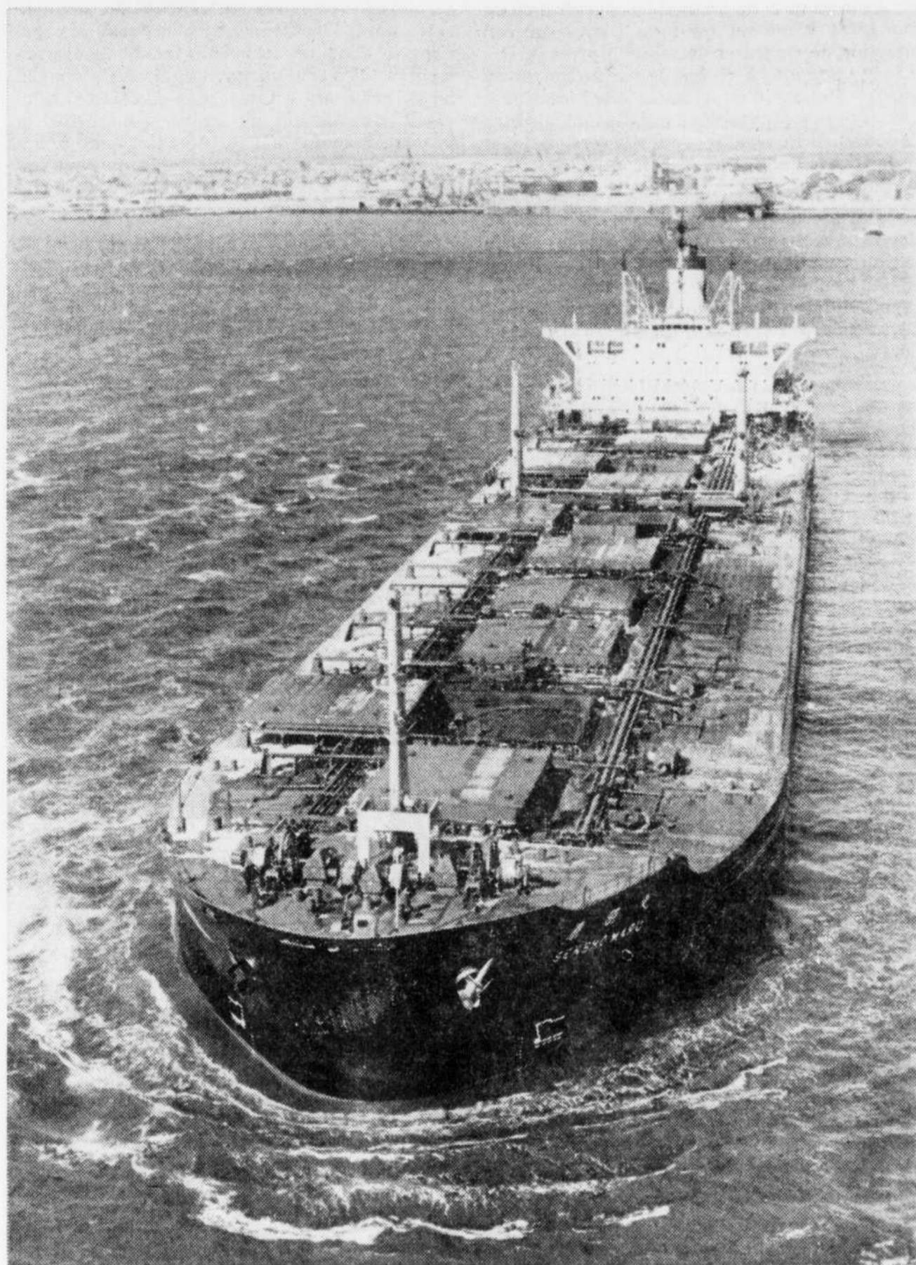
Le "Senso Maru" est reparti avec un chargement de quelque 181.650 tonnes longues et... une once.