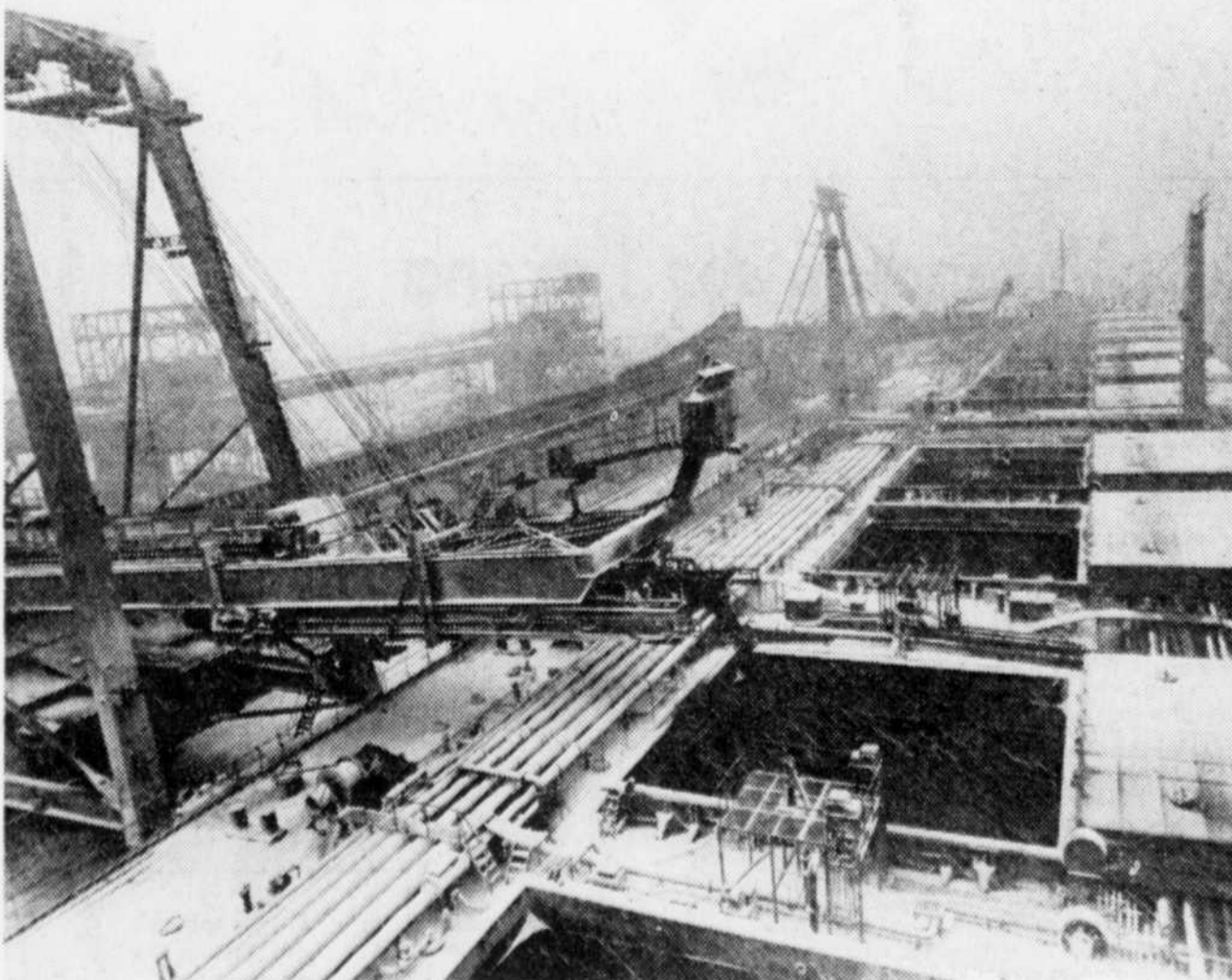
En pleine tempête de neige, les cales du navire se sont remplies de minerai de fer à raison de 15.000 tonnes l'heure.