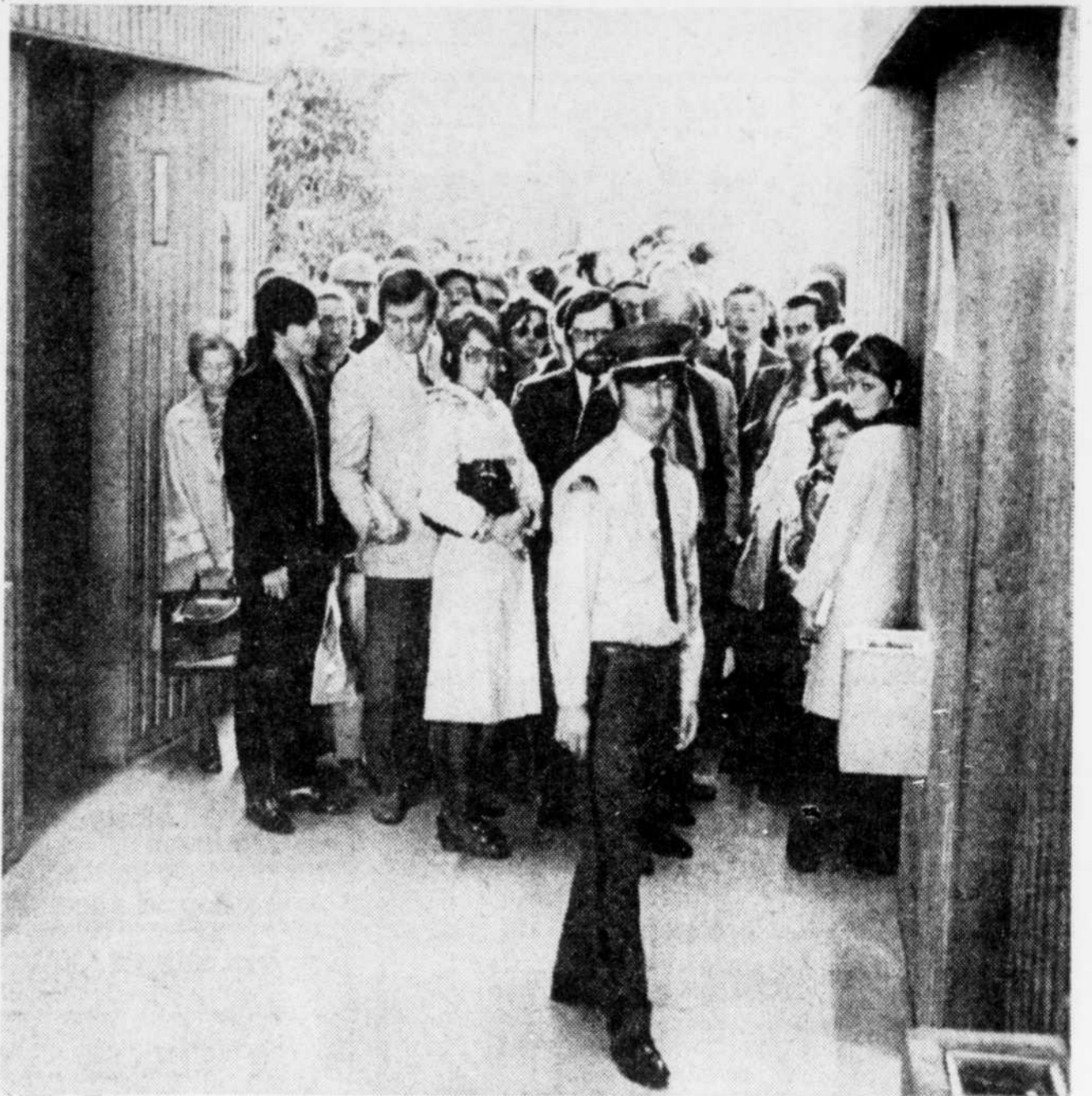
Les employés du complexe "G" doivent souffrir plusieurs pannes d'ascenseurs.