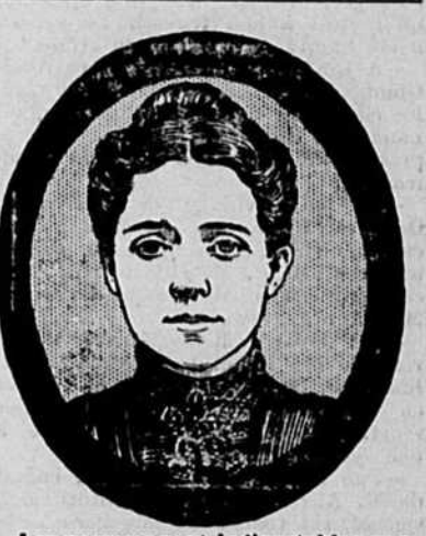
Les preuves sont indiscutables que les femmes traversent, sans accident, les changements de vie en faisant usage du Composé Végétal de Lydia E. Pinkham.